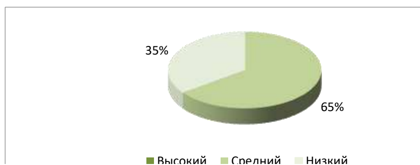
Рисунок 2 – Результаты диагностики подростков по шкале «Делинквентное (допротиповправное) поведение»

Результаты диагностики подростков по шкале «Делинквентное (допротиповправное) поведение (ДП)» представлены на рисунке 2.