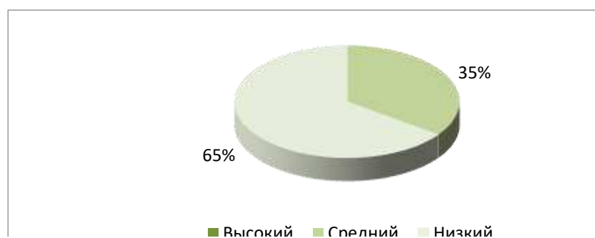
Рисунок 1 – Результаты диагностики подростков по шкале «Социально-обусловленное поведение»

Результаты диагностики подростков по шкале «Социально-обусловленное поведение (СОП)» представлены на рисунке 1.