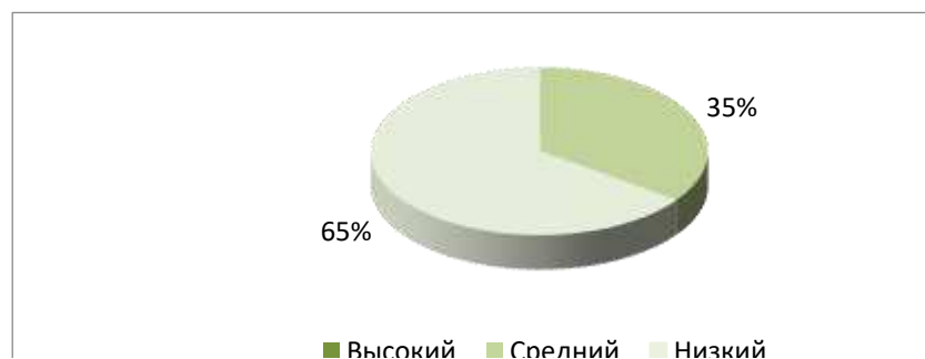
Рисунок 3 – Результаты диагностики подростков по шкале «Зависимое (аддиктивное) поведение»

Мы отмечаем, что по шкале «Зависимое (аддиктивное) поведение (ЗП)» отсутствуют признаки зависимого поведения у 65 % обучающихся. Ситуативную предрасположенность к зависимому поведению демонстрируют 35 % испытуемых, что свидетельствует о наличии тенденций деструктивного поведения, выражающегося в желании ухода от реальности. Высокого уровня по данной шкале не обнаружено.