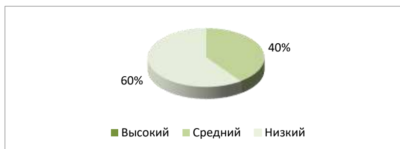
Рисунок 5 – Результаты диагностики подростков по шкале «Суицидальное (аутоагрессивное) поведение»

Результаты диагностики подростков по шкале «Суицидальное (аутоагрессивное) поведение (СП)» представлены на рисунке 5.