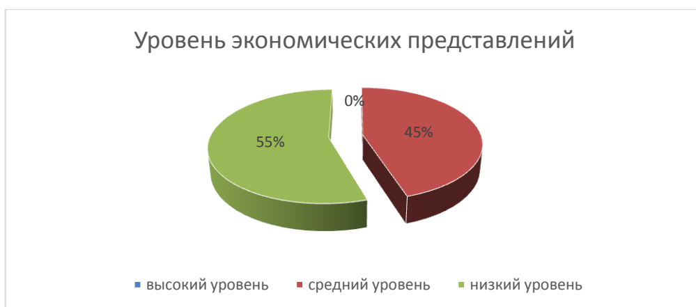
Рис. 1 – Результаты сформированности экономических представлений у старших дошкольников группы «Непоседы» до реализации комплекса занятий

Результаты показали, что у 45% дошкольников низкий уровень экономических представлений: ответы поверхностны, разбросаны; затруднились объяснить значение экономических понятий, их не интересовали потребности их семьи, работа их родителей, дети не использовали экономические слова в ее речи.