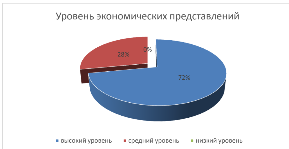
Рис. 2 – Результаты уровня сформированности экономических представлений у старших дошкольников группы «Непоседы» после реализации комплекса занятий

После реализации комплекса занятий по повышению уровня сформированности экономических представлений у детей старшего дошкольного возраста группы «Непоседы» МБОУ «Рождественская средняя общеобразовательная школа» села Рождественское, нами и воспитателем группы была проведена повторная диагностика уровня сформированности экономических представлений старших дошкольников (рис.2.).