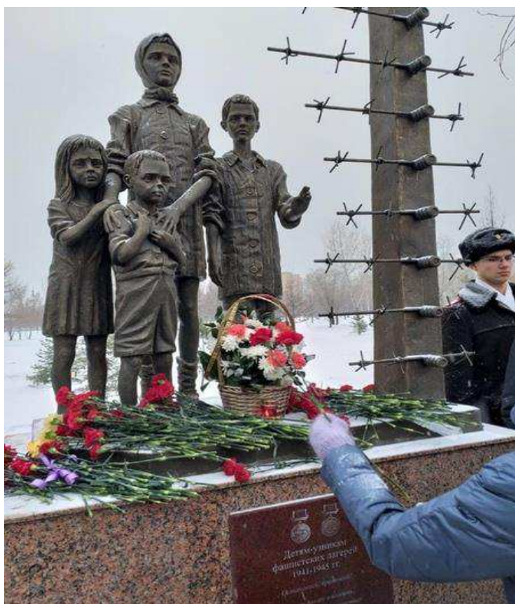
Рисунок 1. 1. Памятник несовершеннолетним узникам концлагерей, парк «Гвардейский», г. Красноярск. Скульптор Ю. Акулов 26

Красноярское региональное отделение издаёт брошюры, буклеты на темы узничества. Появились книги воспоминаний «Плененное детство» и «Не молчи моя память!» 27 . Наличие различного рода сборников и брошюр позволяет вести КРО РСБНУ просветительскую деятельность не только взрослого населения, но и молодежи.