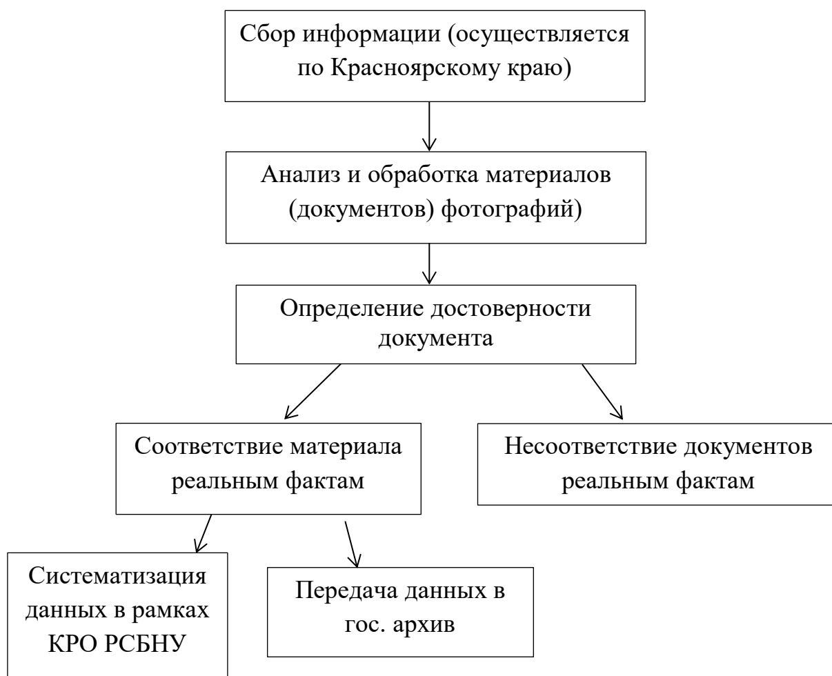
Рисунок 2. 2. Схема документирования данных Красноярского регионального отделения Российского союза бывших несовершеннолетних узников фашистских концлагерей 42

На начальном этапе работы КРО РГБНУ осуществляло поиск, сбор и систематизацию документов, содержащих информацию о пребывании граждан в нацистских концлагерях.