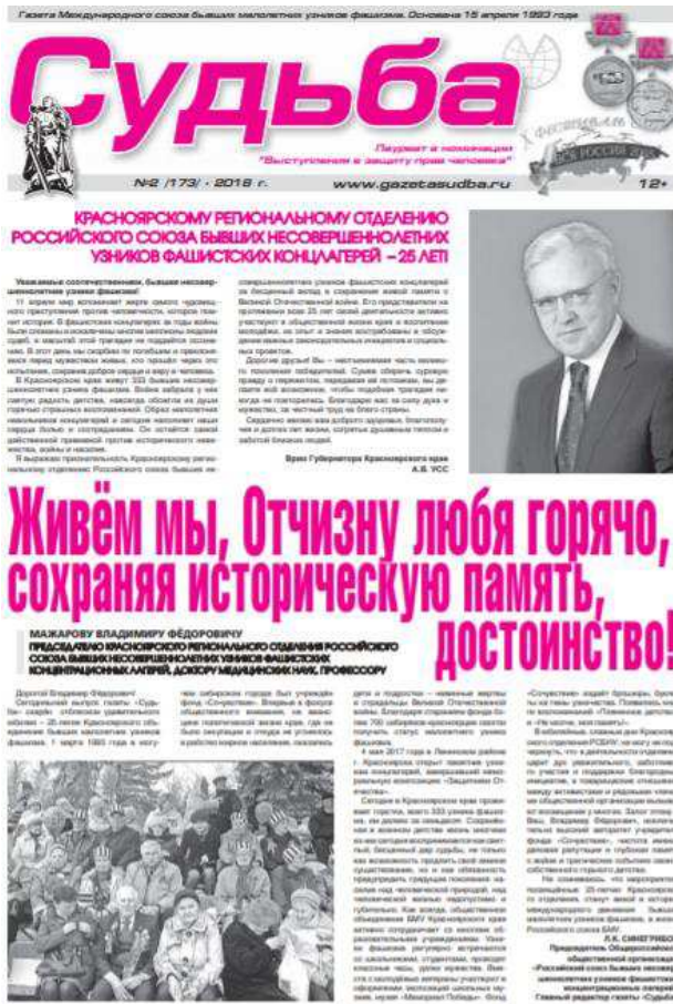
Рисунок 1. 2. Газета Международного союза бывших малолетних узников фашизма 28

Деятельность КРО РСБНУ вносит неоценимый вклад в развитии истории фашизма на региональном уровне. КРО РСБНУ сотрудничает с архивами как краевого так и муниципального уровня в рамках своей деятельности.