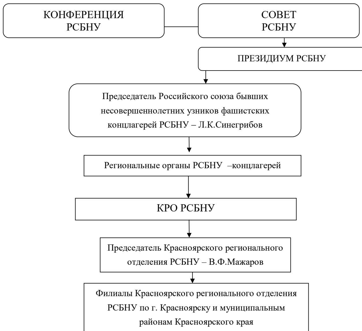
Схема А. 1. Организационная структура Красноярского регионального отделения РСБНУ по г. Красноярску 53