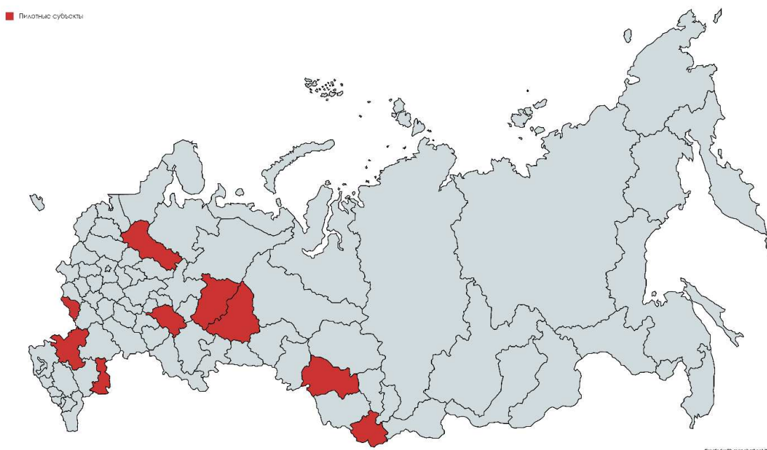
Рисунок 1 – Карта пилотных регионов

После утверждения методологии первые результаты пилотного проекта по разработке демографических данных были опубликованы на сайте Федеральной статистической службы. Работы проводили с октября по ноябрь 2014 года в 9 субъектах Российской Федерации: Пермском крае, Астраханской, Вологодской, Белгородской, Новосибирской, Ростовской и Свердловской областях, республиках Алтай и Татарстан (рисунок 1).