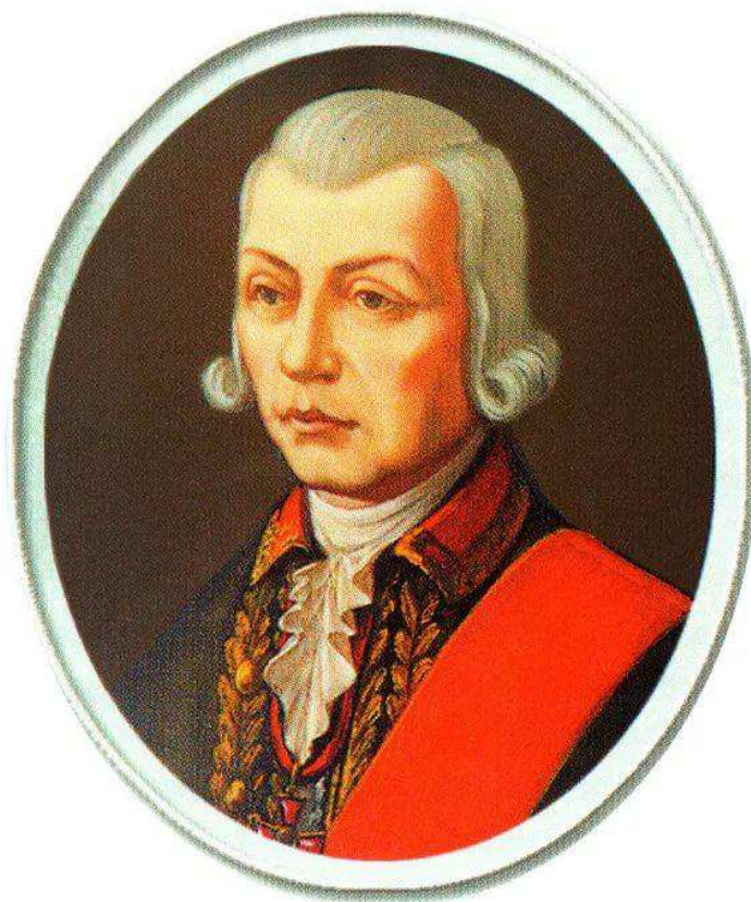
Рисунок 2 - Иван Кириллович Кирилов

Первый статистический и экономический обзор России был сделан И. К. Кириловым (рисунок 2). В книге «Процветающее государство всероссийского государства, в котором он начинал, Петр Великий писал и оставлял невыразимые произведения отца отечества, императора и самодержца всероссийского и других, и других и других», который он написал в 1727 г. В бухгалтерии и статистике используются данные, полученные в Сенате, представленные в таблицах и обобщающие показатели. Также были использованы данные, полученные во время переписи 1710 года и первого пересмотра в 1718 году.