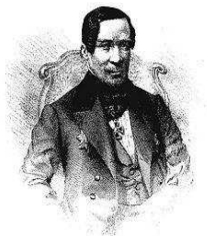
Рисунок 3 - Константин Иванович Арсеньев

Развитие состояния статистики стало возможным благодаря практическим действиям с использованием известной статистики. Статистический отдел Министерства внутренних дел возглавил в 1835-1852 гг. К. И. Арсеньев (рисунок 3). В 1857 году состав статистического комитета пополнился рядом талантливых людей в связи с подъемом уровня образования и экономики в России. Среди них - А.Г. Тройницкий; впоследствии возглавивший Статистический Совет Центрального статистического комитета Министерства внутренних дел А.Б. Бушен; много сделавший для становления статистики населения в России, активно работавший в Центральном статистическом комитете, Министерстве финансов Н.А. Милютин и др.