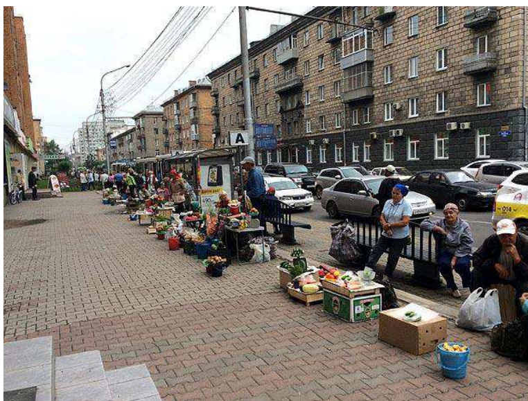
Рис. 8. Уличная торговля в Красноярске

Стоит отметить, однако, что реализация экономической функции иногда отзывается дисфункционалом в других сферах. Уличная торговля, в частности, ответственна за значительную долю мусора на магистралях города.