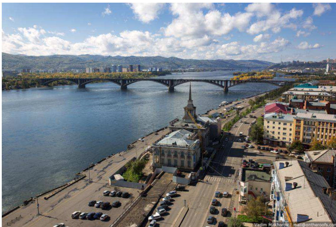
Рис. 3. Набережная Енисея – одна из ключевых мест «красноярской идентичности»

- общественно-деловые пространства города являются ключевыми объектами, задающими образ Красноярска. Набережная Енисея, площади Театральная, Мира и Революции, площадка у часовни Параскевы Пятницы – главные, знаковые территории города.