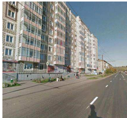
Рис. 7. Улица Калинина, одна из крупнейших в городе – пример общественного пространства, крайне слабо приспособленного для отдыха горожан

Данная функция способствует отдыху горожан. Выполнение её, как и предыдущей, ложится в значительной степени на рекреационные массивы, но также и на общественно-деловую зону.