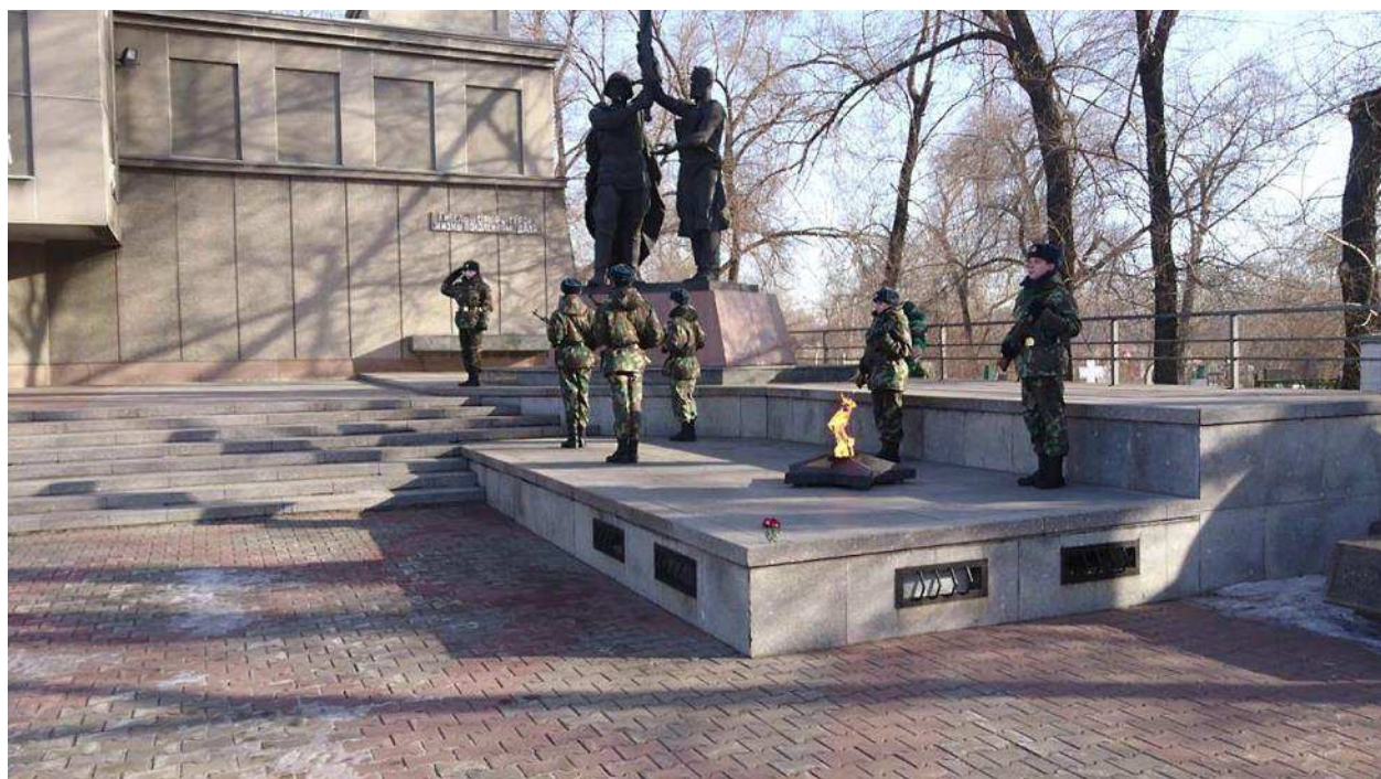
Рис. 10. Почётный караул у мемориала Победы в Красноярске

Другим примером реализации подобной функции являются различные городские и общенациональные традиции и ритуалы. Например, традиция почётного караула у вечного огня на мемориале Победы, которая сохраняется на протяжении многих десятилетий. Либо пасхальный крёстный ход, традиций, насчитывающая не один век.