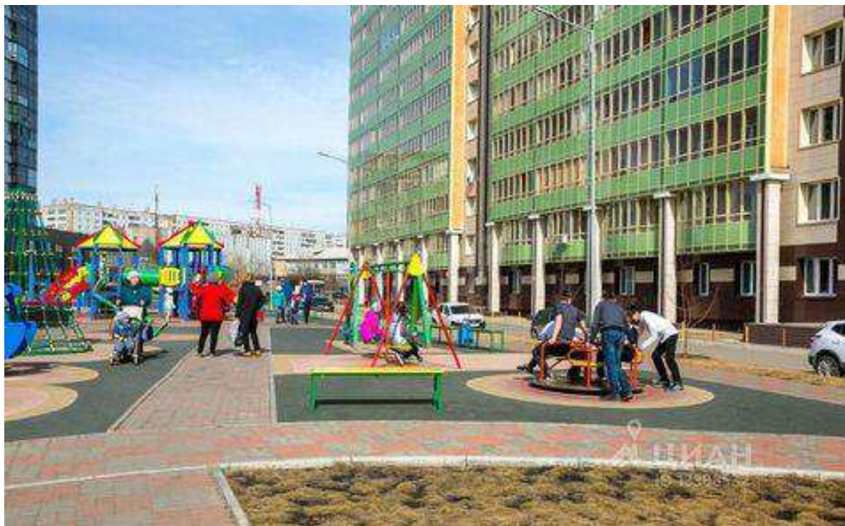
Рис. 4. Дворы Красноярска на протяжении многих десятилетий остаются основной коммуникационной площадкой жителей

советского общежития начала разрушаться уже в конце эпохи СССР, однако во многом остаётся значимой и по сей день.