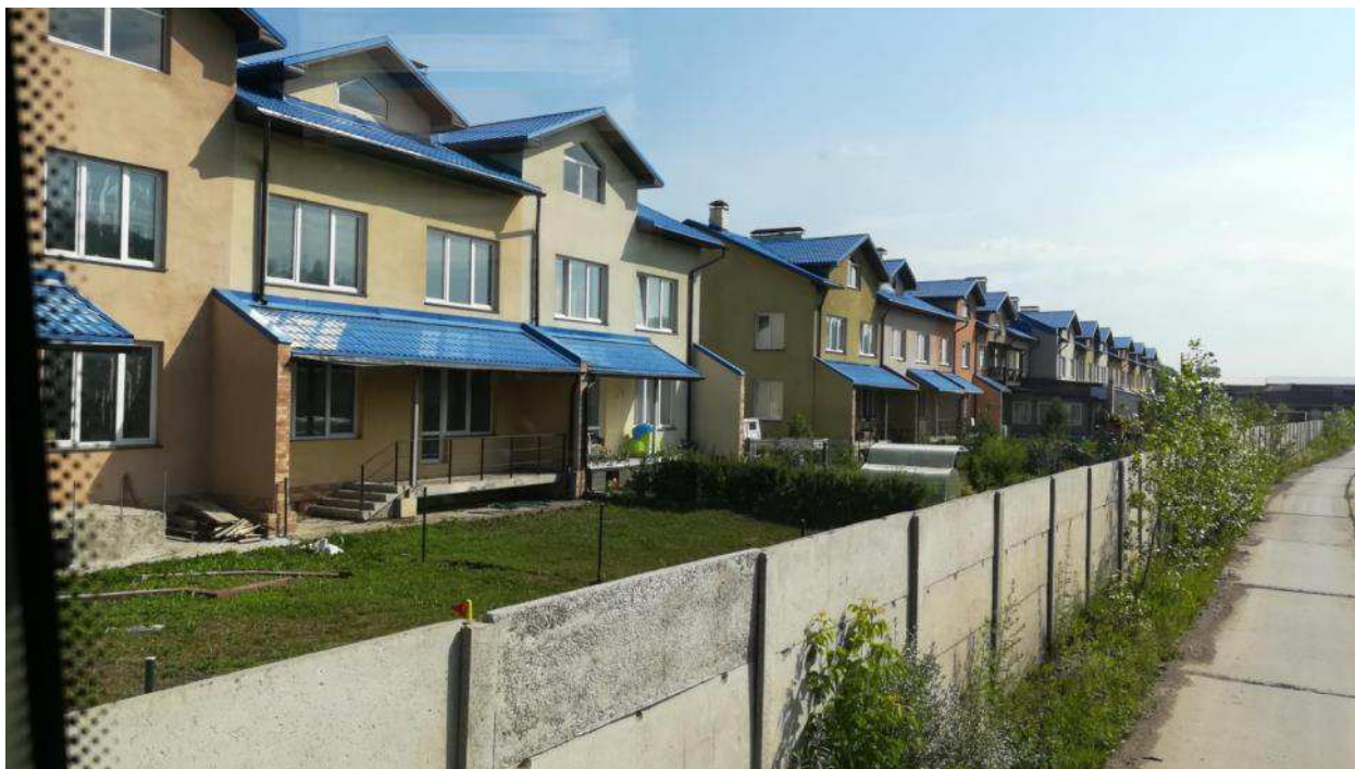
Рис. 9. Посёлок «Английский парк» - пример жилого массива в Красноярске, закрытого для посторонних

Отметим здесь и дисфункционал другого рода – открытость территорий Красноярска, достигшая максимума к началу 1990-х, постепенно снижается. Для посторонних закрыта сейчас значительная часть садовых товариществ, а также отдельных жилых массивов (микрорайоны Горный, ЖК Удачный и т.д.)