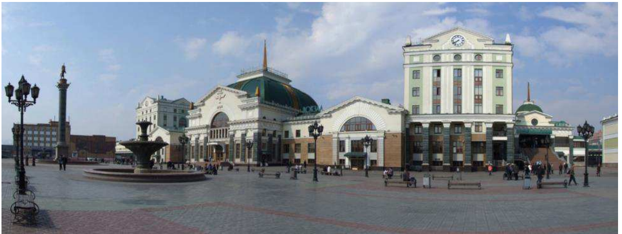
Рис. 6. Многие общественные пространства Красноярска (на фото – привокзальная площадь) полностью лишены растительности