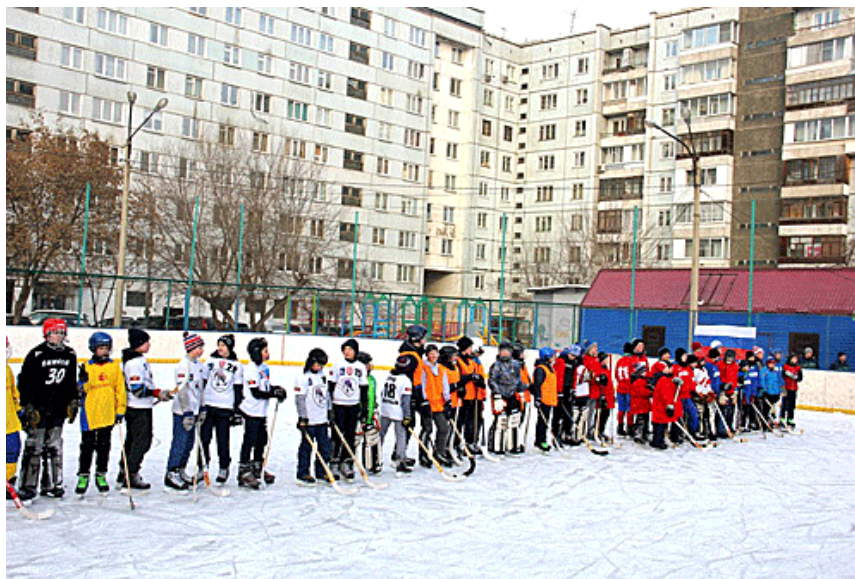
Рис. 5. Реализация объединяющей функции двора, как общественного пространства – дворовая хоккейная команда

Улицы и дворы эту функцию реализуют, преимущественно, за счёт того, что формируют местные сообщества. Примером таких сообществ могут быть, например, детские коллективы («дворовая ватага»).