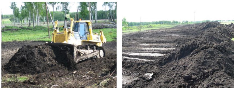
Рис. 2. Фрагменты первого этапа горнотехнической рекультивации: а) снятие плодородного слоя почвы бульдозером и укладка его во временный склад; б) временный склад плодородного слоя почвы, подготовленный к отгрузке экскаватором, работающем на верхнем вскрышном уступе

Обоснование мест размещения буртов ПСП в границах карьерного поля, основанное на результатах эколого-математического моделирования, подтвердило гипотезу о том, что увеличение количества секторов при раскройке карьерного поля вдоль фронта горных работ с двух до пяти приводит к увеличению содержания гумуса и снижению глинистых фракций в формируемой продуктивной смеси в ходе селективной отработки экскаваторного забоя. В условиях совмещения вскрышных работ с работами горнотехнического этапа рекультивации предлагаем продуктивную смесь для ее нанесения на поверхность породных отвалов формировать карьерным экскаватором. При этом в ходе разделения забоя экскаватора на выемочные секторы необходимо и целесообразно использовать главное условие отсыпки отвала, выполнение которого обеспечит укладку вскрышных пород без гумуссодержащих почвенных слоев в слой, отсыпaeмый ниже дневной поверхности отвала на 2,0 м, а смесь вскрышных пород с почвенными слоями (ПСП и ППП) – непосредственно в поверхностный слой отвала.