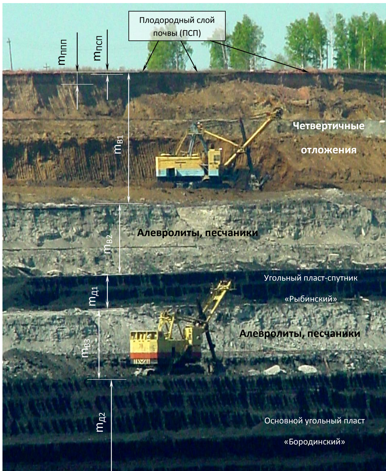
Рис. 1. Фрагмент вертикального геологического разреза, представленного вскрышной рабочей зоной угольного разреза «Бородинский»

глин, суглинков, супесей, песков. Четвертичные отложения распространены в виде сплошного чехла различной мощности ( m_{B1} ) до 30 м (рис. 1).