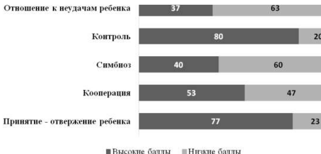
Рис. 4. Соотношение процентов высоких и низких баллов по шкалам родительских отношений