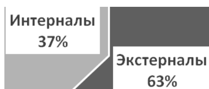
Рис. 2. Процентное соотношение интерналов и экстерналов Fig. 2. Percentage ratio of internals and externalities

достоинством выходить их сложных жизненных ситуаций, а в случае неудач в деятельности – критически относиться к себе, к собственной осведомленности, стремлению к достижению цели, уровню развития способностей (рис. 2).