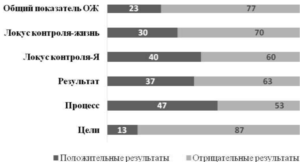
Рис. 3. Соотношение процентов положительных и отрицательных значений по шкалам смысловых ориентаций

процесс достижения эффективности в любом начинании. Эти подростки способны осуществлять самоконтроль, нести ответственность за принятые решения.