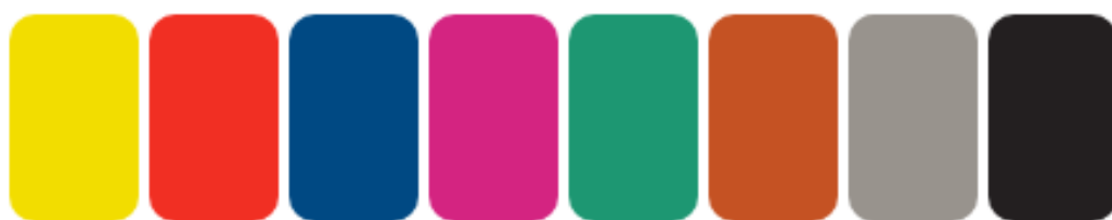
Рисунок 2 – Карточки, предоставляемые респондентам

Продолжение инструкции: «Хорошо, а теперь выберите наиболее симпатичный цвет из оставшихся». Эта инструкция (и, соответственно, выборы испытуемого) повторяется до тех пор, пока перед испытуемым не останутся три последних карточки. М. Люшер считает, что, в среднем, последние три цвета воспринимаются испытуемыми как неприятные. Поэтому для облегчения работы испытуемого инструкция изменяется: «Хорошо, а теперь укажите наиболее несимпатичный, неприятный цвет из оставшихся». Такое инструктирование выбора испытуемого позволяет распределить 8 цветов в ряд по степени убывания их субъективной приятности [27].