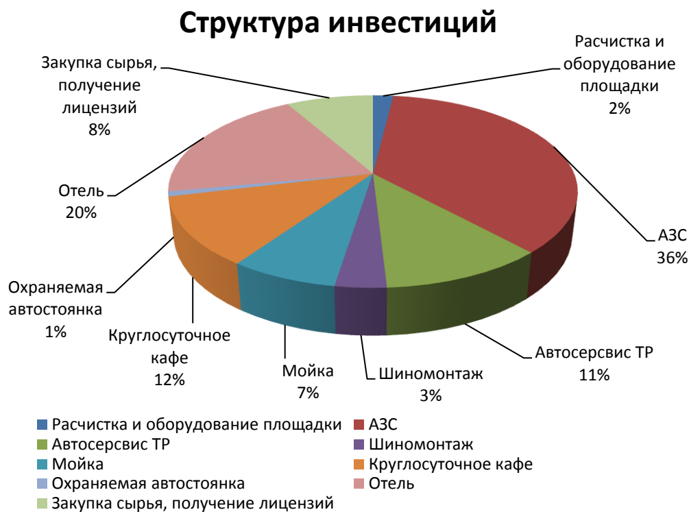
Рисунок 1 – Структура инвестиций

Из диаграммы видно, что самая дорогостоящая составляющая комплекса является АЗС, поэтому для сокращения затрат, создание авто комплекса можно начать на базе уже действующий АЗС. Причем репутация и объем оборота АЗС окажут значительное влияние на первоначальное развитие комплекса.