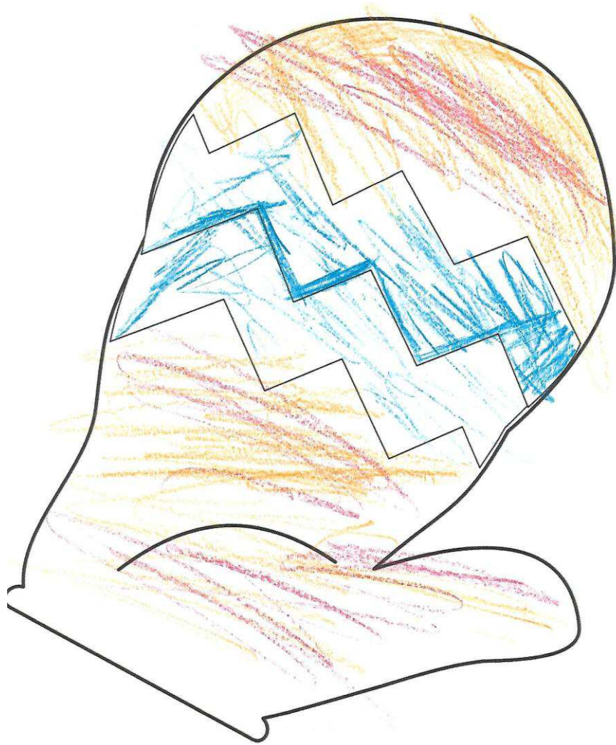
Рисунок 1 – Рукавичка Максима В.

Результат методики «Рукавички» Г.А. Цукермана