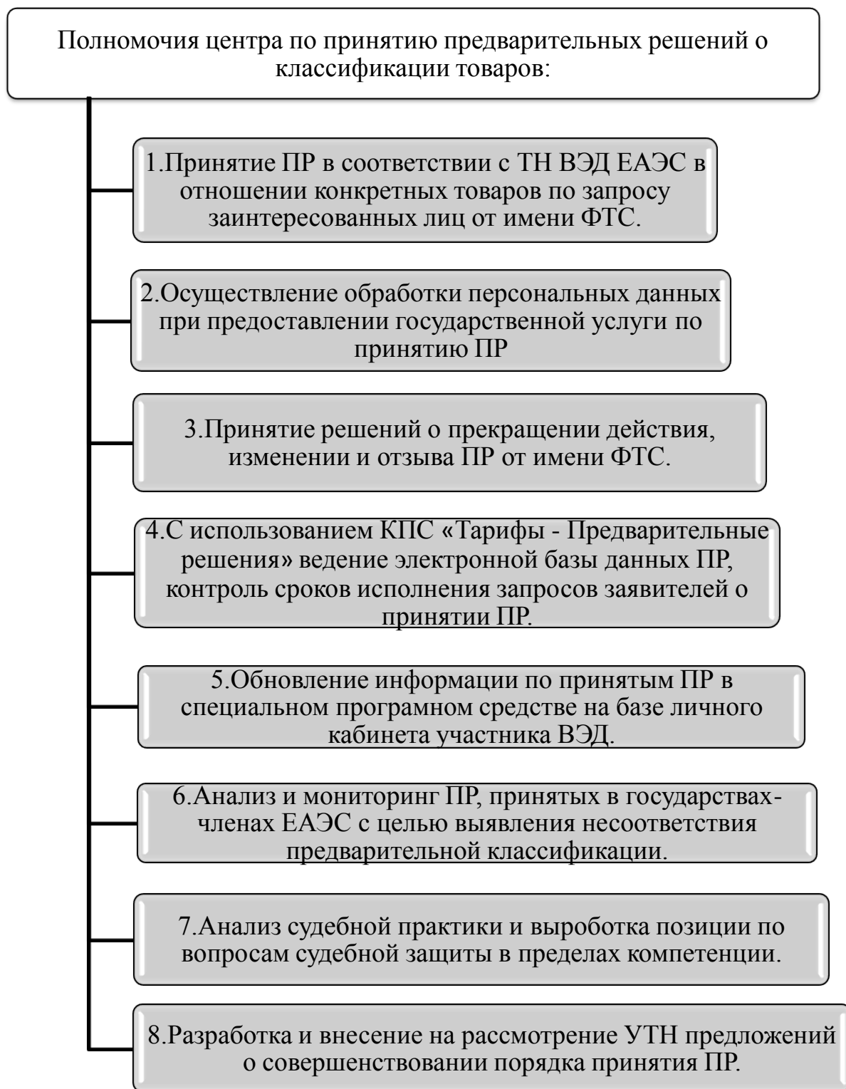
Рисунок 5 – Полномочия центра по принятию предварительных решений о классификации товаров

Обоснованно предложение наделить центр по принятию предварительных решений следующими полномочиями в пределах его компетенции, представленными на рисунке 5.