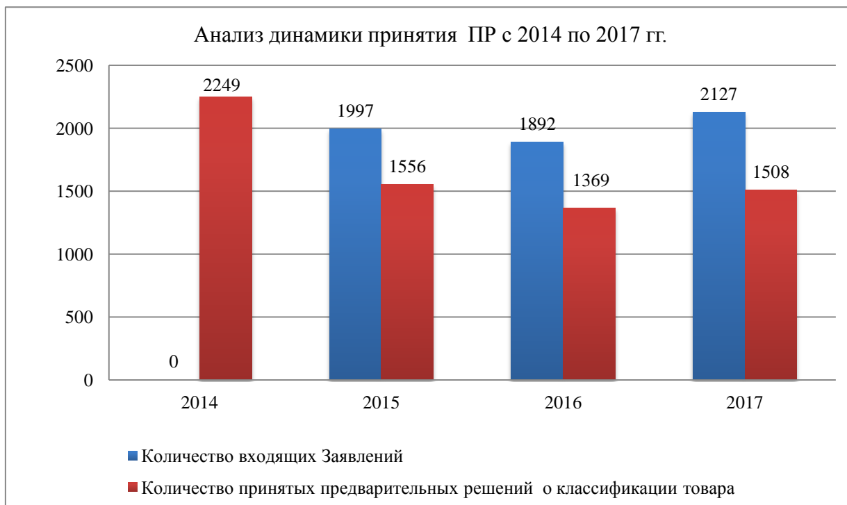
Рисунок 1 – Анализ динамики принятия ПР с 2014 по 2017 гг.

В настоящее время таможенные органы РФ имеют большой опыт принятия ПР: только за период с начала 2014 г. до конца 2018 г. было принято 7 794 ПР. Вместе с тем необходимо отметить, что, в соответствии с рисунком 1, в среднем примерно по 20% принятых Заявлений принимается решение об отказе в их рассмотрении либо решение об отказе в принятии ПР.