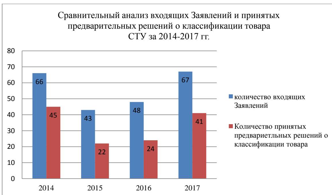
Рисунок 3 – Сравнительный анализ входящих Заявлений и принятых предварительных решений о классификации товара СТУ за 2014-2017 гг.

Таким образом можно сделать вывод, что в настоящее время таможенные органы Российской Федерации имеют большой опыт в принятии ПР. Однако судебная практика указывает на то обстоятельство, что во многих случаях по оспариванию принятых ПР суд принимает сторону участника ВЭД. Это связано с тем, что классификация товаров в соответствии с ТН ВЭД ЕАЭС является достаточно сложным процессом, поскольку для того чтобы отнести товар к конкретному коду ТН ВЭД ЕАЭС изучение одного описания товаров не достаточно. Для правильной классификации необходимо учитывать Примечания к ТН ВЭД ЕАЭС, тексты товарных позиций и правильно применять основные правила интерпретации ТН ВЭД ЕАЭС. Более того, нередко должностным лицам таможенных органов приходится прибегать к изучению специальных технических регламентов и стандартов на различные виды товаров с целью определения толкования различного рода терминов. Совершение данных операций требует большого объема знаний в совершенно противоположных отраслях знаний, что предполагает наличие целого комплекса специальных познаний,