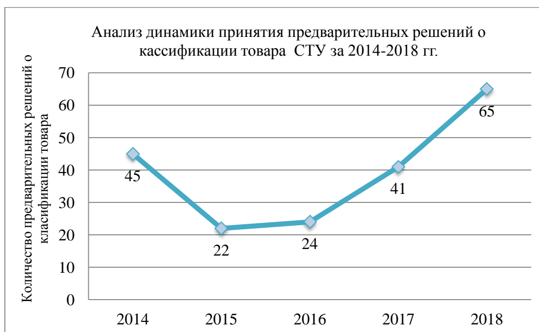
Рисунок 2 – Анализ динамики принятия предварительных решений о классификации товара СТУ за 2014-2018 гг.

Анализируя деятельность СТУ по принятию ПР, в соответствии рисунком 2, можно сделать вывод, что в настоящее время наблюдается планомерное увеличение количества принятых ПР. По сравнению с прошлым годом в 2018 году СТУ приняло на 24 ПР больше, то есть количество принятых ПР увеличилось на 36,9 %. Вместе с тем, необходимо отметить, что несмотря на это обстоятельство доля принятых ПР СТУ в 2018 году составила всего 5,8 % от общего числа принятых ПР. Наибольшее количество принятых ПР приходится на ЦТУ. В 2018 году ЦТУ приняло 522 ПР, что составило 47 % от общего количества принятых ПР в 2018 году.