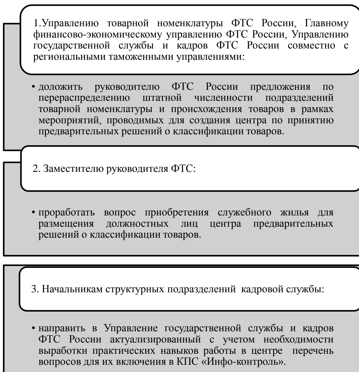
Рисунок 4 – Алгоритм создания центра по принятию предварительных решений о классификации товаров, лист 1

В целях выполнения приказа ФТС представляется необходимым выполнить следующие действия, алгоритм которых для удобства представлен на рисунке 4.