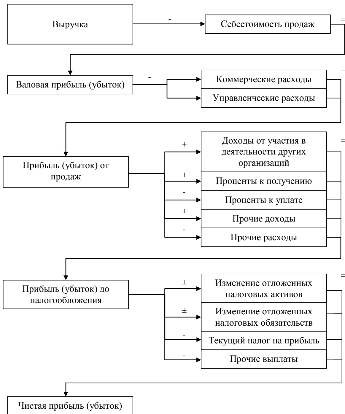
Рисунок 1.1 – Порядок формирования прибыли торгового предприятия

Прибыль предприятия формируется и отражается в Отчете о финансовых результатах. Схема формирования прибыли предприятий торговли представлена на рис. 1.1.