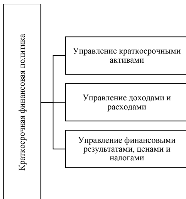
Рисунок 2 – Элементы краткосрочной финансовой политики [13]

Политика, связанная с управлением доходами, расходами и финансовыми результатам компании также играет особую роль в реализации краткосрочной финансовой политики. В рамках этой политики осуществляют проведение операционного анализа, в целях установления взаимосвязи между тремя ведущими показателями «Доходы – Расходы – Прибыль». Данная политика обеспечивает решение двух важнейших задач: увеличение совокупных доходов и минимизация расходов компании. В результате решения данных задач может быть обеспечено достижение главной цели компании – максимизация прибыли.