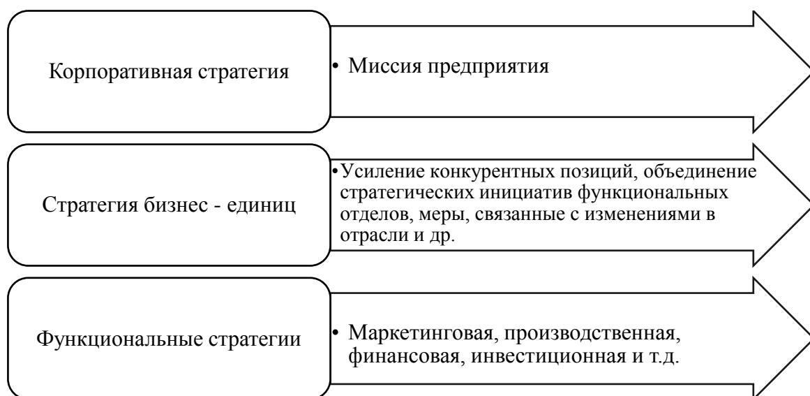
Рисунок 3 - Модель концепции стратегического управления предприятием [24]

Модель концепции стратегического управления предприятием представлена на рисунке 3.