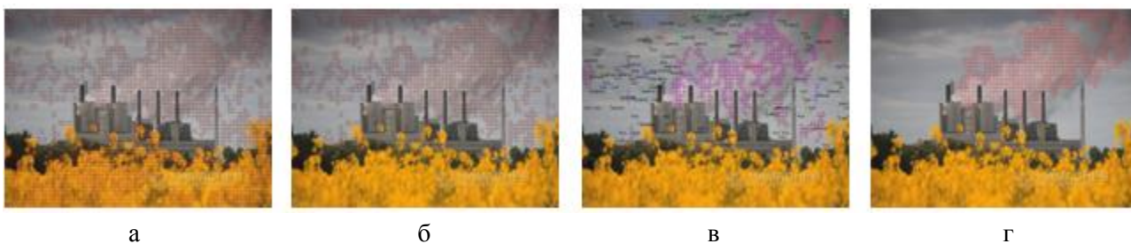
Рис. 3. Этапы выделения дальнего дыма по видеопоследовательности Youtube/Factory_13 [14] (кадр 2274) с параметрами алгоритма: Blk = 15 , T = 25 , Rate = 3 : а) все движение в кадре, б) серое движение в кадре, в) расчет турбулентности, г) результат работы алгоритма.