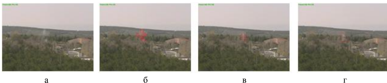
Рис. 1. Кадры видеопоследовательности Bilkent/ISYAM, кадр 116 [12]: а) исходный кадр видеопоследовательности под номером 116, б) результаты детектирования с размером блока 8 пикселей (кадр 116), в) результаты детектирования с размером блока 15 пикселей (кадр 82), г) результаты детектирования с размером блока 30 пикселей (кадр 88).

Метод соответствия блоков является простым, быстрым и относительно надежным способом нахождения движения в сцене. Он основан на сопоставлении центрального блока (изображение разделено на непересекающиеся блоки) с восемью соседними блоками. При этом минимизируется функционал ошибки e(\cdot) в соответствии с выбранной метрикой: сумма абсолютных разностей (Sum of Absolute Differences, SAD), сумма квадратов разностей (Sum of Squared Differences, SSD) или среднее квадратов разностей (Mean of Squared Differences, MSD) соответственно. Эксперименты показали, что можно выбирать различные значения размеров блоков для ближних и дальних сцен (рисунок 1).