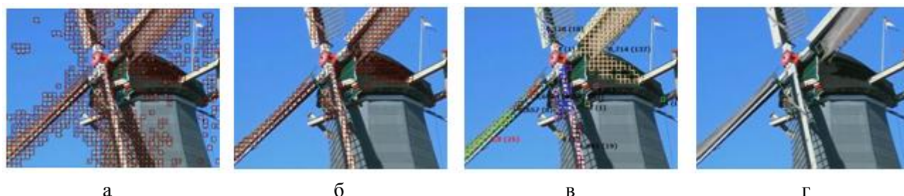
Рис. 4. Этапы выделения дыма по видеопоследовательности без дыма Dyntex/648ab10 [15] (кадр 1) с параметрами алгоритма: Blk=8 , T=20 , Rate=1 : а) все движение в кадре, б) серое движение в кадре, в) расчет турбулентности, г) результат работы алгоритма.

Обнаружение пламени. Пламя также характеризуется пространственно-временными признаками, однако признаки движения играют менее существенную роль по сравнению с признаками движения дыма. Для обнаружения пламени целесообразно анализировать за-