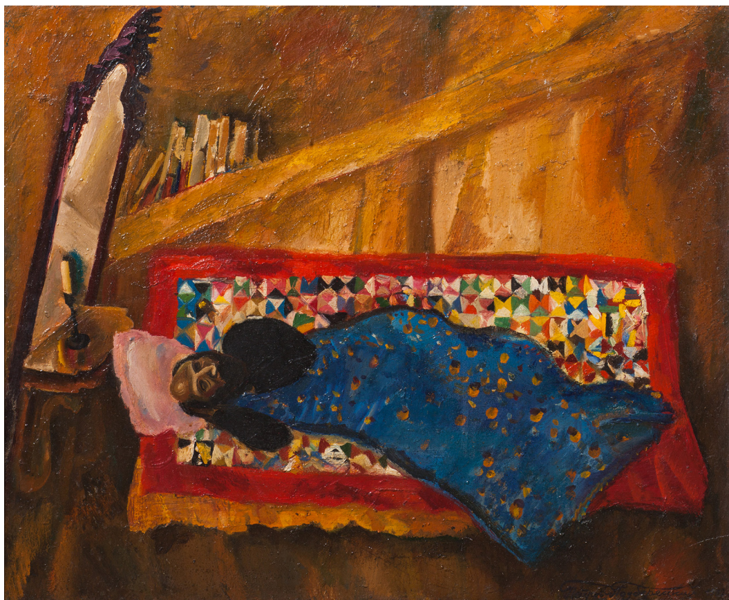
Рис. 6. Константин Петров. Отец в мастерской. 1991. Холст, масло. 60x80