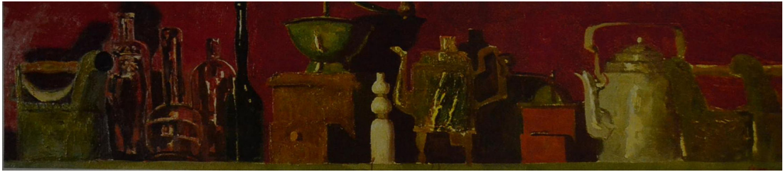
Рис. 8. Константин Петров. Красный натюрморт. 2014. Холст, масло. 45x200. Собственность автора Fig. 8. Konstantin Petrov. Red still life. 2014. Canvas, oil. 45x200. Author's property