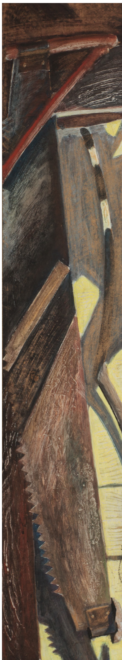
Рис. 10. Константин Петров. Пила. 2004. Оргалит, смешанная техника. 130x35. Собственность автора