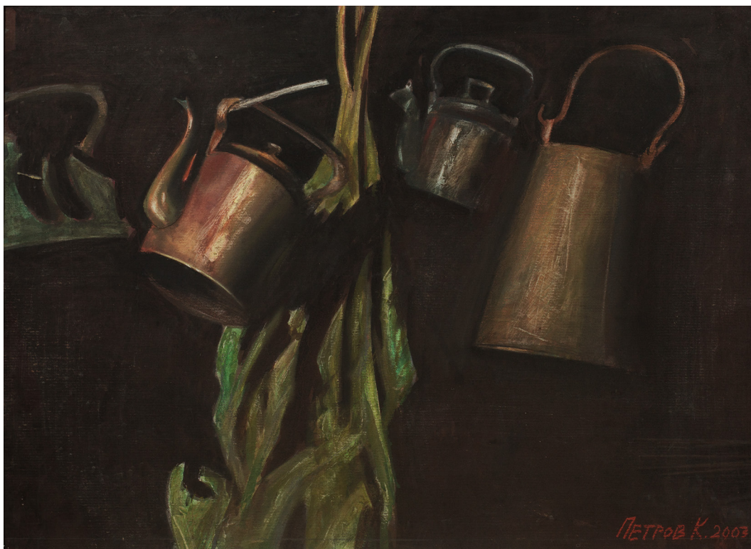
12. Константин Петров. Чайники. 2005. Картон, смешанная техника. 65x95. Собственность автора