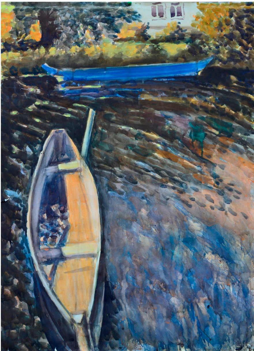
Рис. 2. Константин Петров. Август в Переславле. 2016. Бумага, акварель. 80x50. Собственность автора Fig. 2. Konstantin Petrov. August in Pereslavl. 2016. Paper, watercolor. 80x50. Author's property