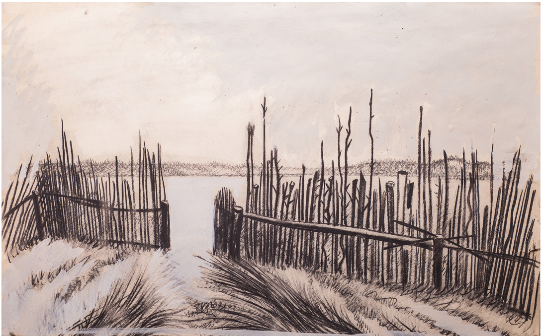
Рис. 3. Константин Петров. Калитка в вечность. 2017. Бумага, уголь. 63х97. Собственность автора Fig. 3. Konstantin Petrov. The gate to eternity. 2017. Paper, charcoal. 63x97. Author's property