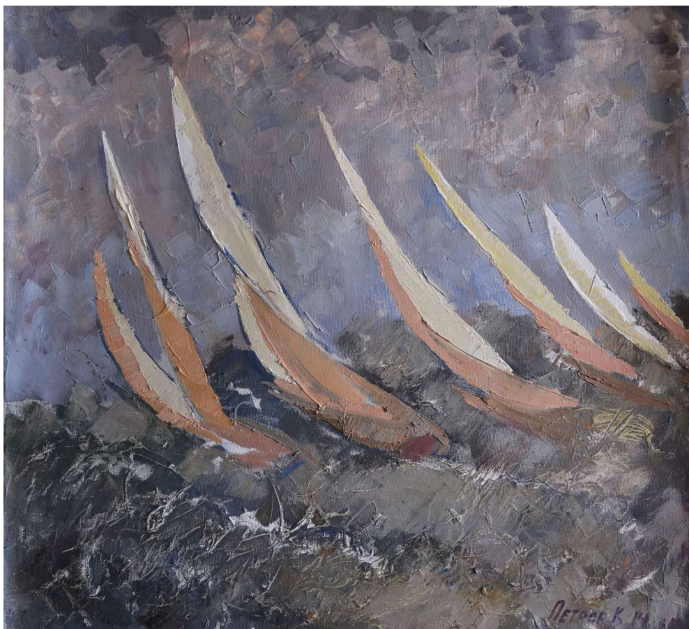
Рис. 4. Константин Петров. Регата. 2014. Холст, масло. 80x90. Собственность автора Fig. 4. Konstantin Petrov. The regatta. 2014. Canvas, oil. 80x90. Author's property