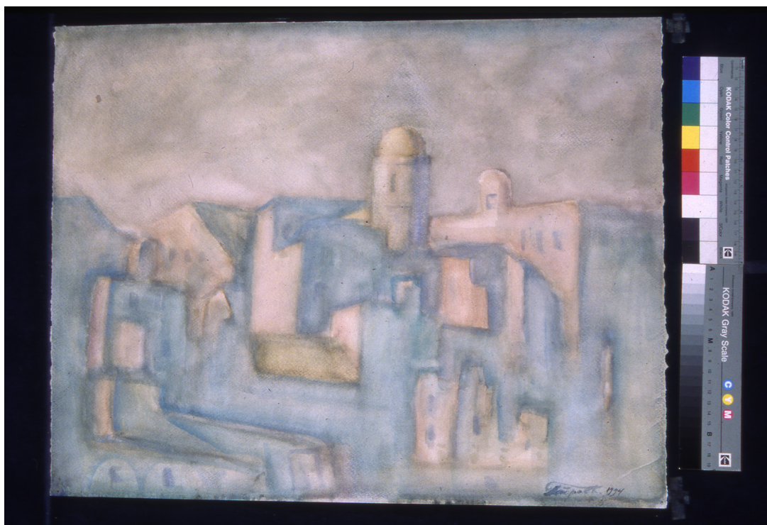
Рис. 1. Константин Петров. Утро в Кониле (из серии «Испания»). 1993. Бумага, акварель. 45х65. Собственность автора Fig. 1. Konstantin Petrov. Morning in Konila (from the series "Spain").1993. Paper, watercolor. 45x65. Author's property