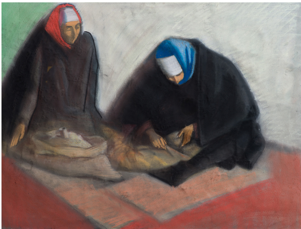
Рис. 7. Константин Петров. Торговки. 1997. Бумага, пастель. 60x85. Собственность автора