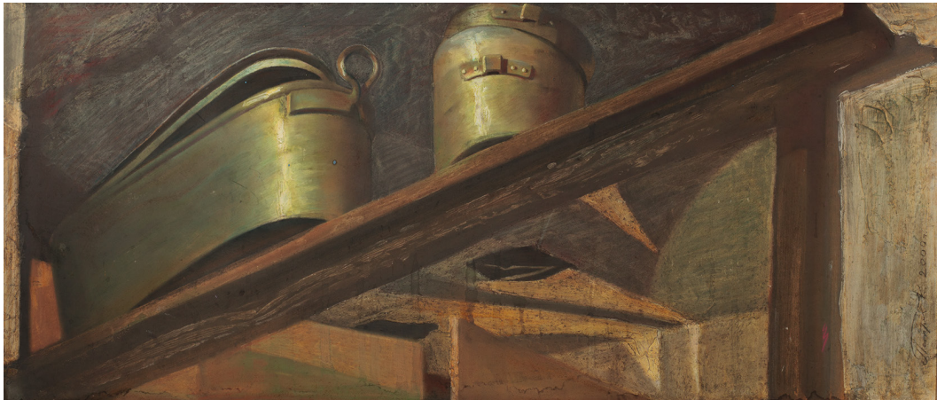
Рис. 9. Константин Петров. Полка. 2005. Оргалит, смешанная техника. 45x170. Собственность автора Fig. 9. Konstantin Petrov. Shelf. 2005. Hardboard, mixed media. 45x170. Author's property