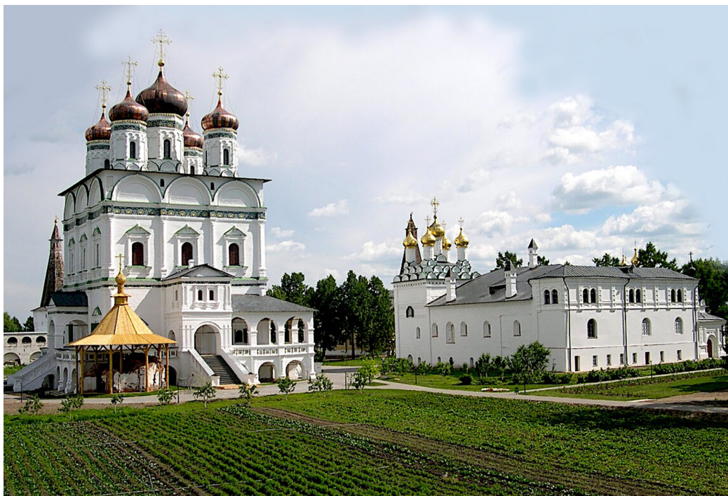
Рис. 1. Иосифо-Волоколамский монастырь. Справа – Трапезная палата с церковью Богоявления (нач. XVI в.), слева – Успенский собор (XVII в.)