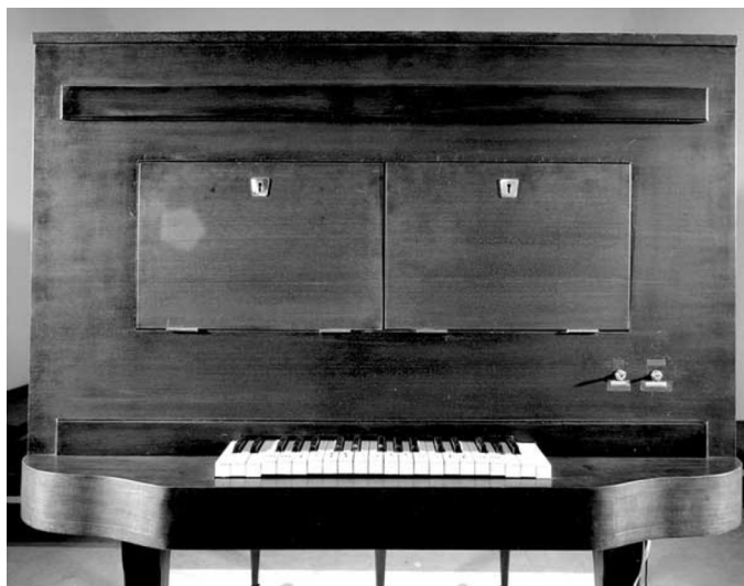
Рис. 3. Оптофоническое фортепиано В.Д. Баранова-Россинэ.