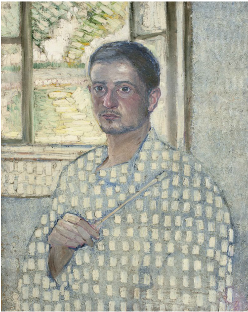
Рис. 1. Автопортрет Владимира Давидовича Баранова-Россинэ. 1907 г.