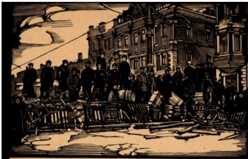
Рис. 4. Революция 1905 г. (линогравюра, размер 9х13 см).