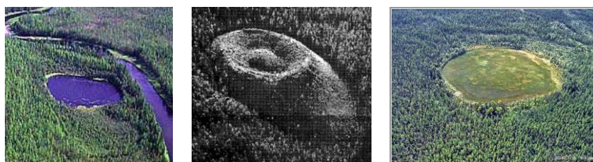
Рис. 1. Структуры, предположительно связываемые с Тунгусским событием

О природе Тунгусской катастрофы существует много гипотез, и причиной тому является факт отсутствия крупного кратера в эпицентре взрыва. Однако в отчётах экспедиций разных лет есть сообщения о некоторых структурах, предположительно связанных с Тунгусским событием: «таинственное озеро», воронки диаметром до 400 м, кратер, расположенный в 26 км к северо-западу от эпицентра взрыва и т.д. (рис. 1).