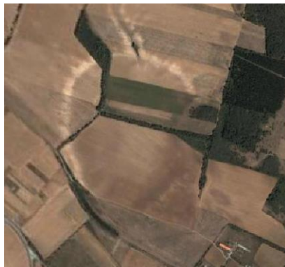
Рис. 5. Кратер Медешьпуста

Кратер Медешьпуста имеет чётко выраженную круговую структуру на спутниковом снимке (рис. 5). И, хотя петрофизические подтверждения космогенности пока отсутствуют, электромагнитные, гравитационные и магнитные данные показывают наличие зон дробления вмещающих доломитовых пород.