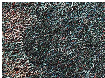
Рис. 4. Импактный кратер Корбетт

Необходимо также отметить данные исследований Джеймса Корбетта по открытой им предполагаемой ирландской структуре. После фильтровой обработки спутниковой карты Mapbox им были выявлены следы восточной стенки кратера (рис. 4).