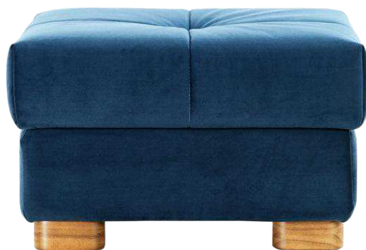
Рисунок 4 – Пуф Джонс