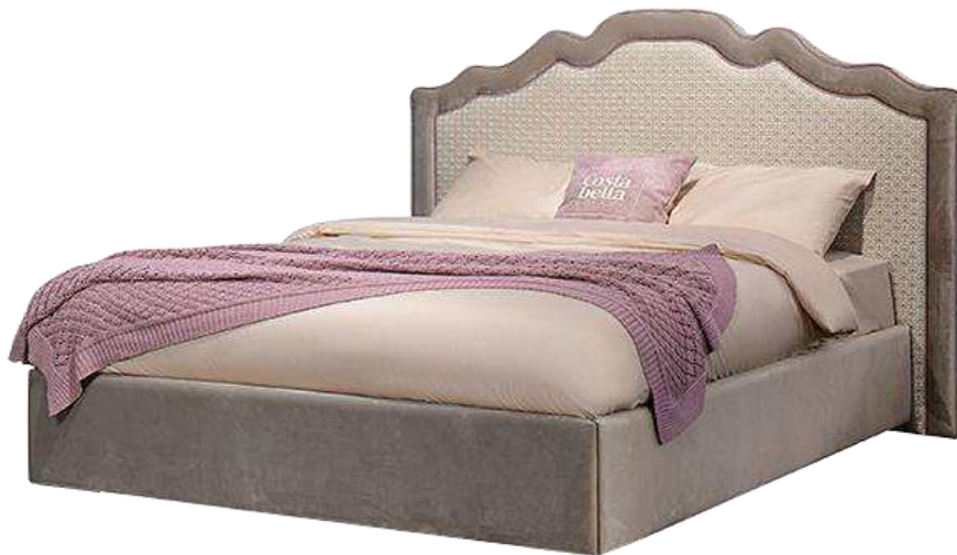
Рисунок 7 – Кровать Лаура

По статистике с 2015 по 2017 год прирост продаж в процентном соотношении: