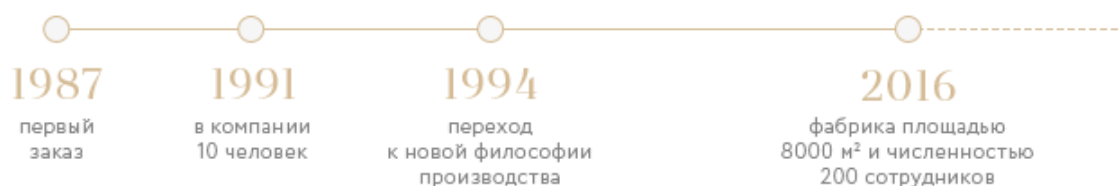
Рисунок 1 – Путь развития ООО «Коста-Белла»

«Коста-Белла» прошла большой путь (рисунок 1), она была маленьким бизнесом с большими мечтами, но теперь это большая фабрика площадью 8000 квадратных метров, лучшее немецкое оборудование и 200 сотрудников.