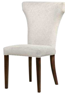
Рисунок 6 – Стул банкетный