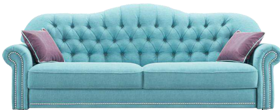
Рисунок 2 – Диван Роял