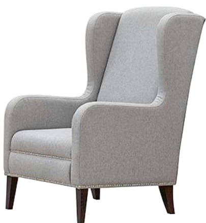
Рисунок 3 – Кресло Чарли