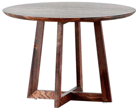
Рисунок 5 – Столик Пиетро