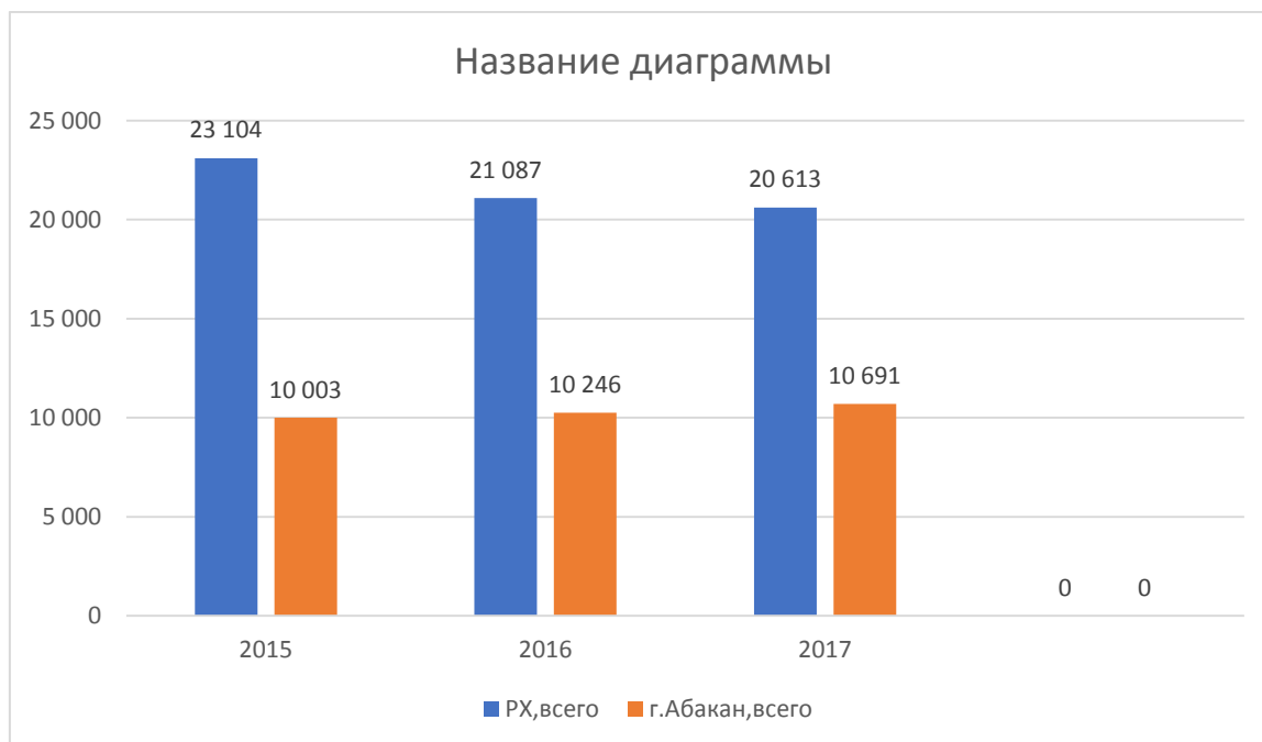
Рисунок 2.2 -Количество субъектов малого и среднего предпринимательства г. Абакана

На рисунках 2.1 и 2.2 представлена информация о количестве малых и средних предприятий.