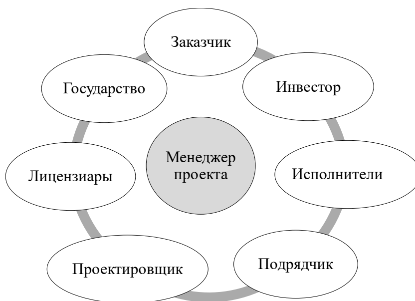
Рисунок 3 – Основные участники проекта

Реализация замысла проекта обеспечивается участниками проекта. В зависимости от вида проекта в его реализации могут принимать участие от одной до нескольких десятков организаций. У каждой из них свои функции, степень участия в проекте и мера ответственности за его судьбу. Вместе с тем все эти организации в зависимости от выполняемых ими функций принято объединять в конкретные группы участников проекта (рисунок 3).