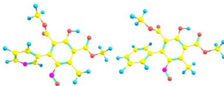
Рис. 1. Геометрическое строение 2,6-ди(метоксикарбонил)-3-метил-5-пиридин-3-ил-4-нитрозофенола и 2,6-ди(метоксикарбонил)-3-метил-5-фенил-4-нитрозофенола

В результате проведённых вычислений показано (рис. 1), что расположение пиридинового и фенольного колец друг относительно друга не является ни копланарным, ни ортогональным. Абсолютное значение торсионного угла \theta(\text{C1C2C3C4}) (рис. 2) между ними находится в диапазоне от 47,3 до 56,7^\circ либо от 125,5 до 128,7^\circ (табл. 1).