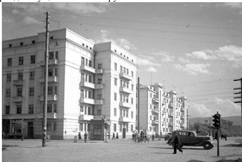
Рис. 2. Красноярск. Здания каменного квартала. Фото 1930-х гг. (Красноярский краеведческий музей)

В 1938 году группа специалистов из московского Горстройпроекта, которую возглавлял архитектор А. М. Мостаков, выполнила «Проект первой очереди реконструкции центрального района левобережного Красноярска» [Государственный архив Красноярского края Ф. Р-2224. Оп. 1. Д. 12. 1938 г.]. В пояснительной записке к проекту дано краткое описание строений рассматриваемого квартала, находившихся на проспекте Сталина (бывшей Советской улице), из которого следует, что к концу 30-х годов квартал между переулком Декабристов (бывший пер. Красный) и улицей Робеспьера был почти застроен за исключением отрезка, где находился временный кинотеатр. По мнению архитекторов, необходимо было внести в этот квартал следующие дополнения: 4-х этажный дом, если возможно, надстроить до пяти этажей; следующий дом в четыре этажа можно сохранить на ближайшем этапе без надстройки; пространство, где находился кинотеатр, следовало заполнить домом «на основе продолжения достройки пятиэтажного углового дома железной дороги» [Государственный архив Красноярского края. Ф. Р-2224. Оп. 1. Д. 12. 1938 г.]. Архитектурно-планировочные преобразования каменного квартала продолжились в послевоенный период и осуществлялись на рубеже веков.