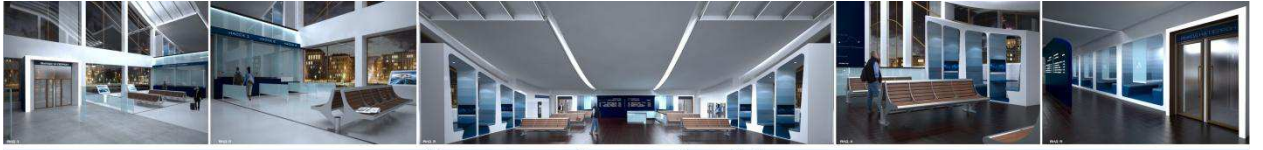
Железнодорожный вокзал в Северобайкальске