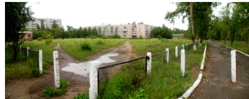
Рисунок 1 – Ситуационный план участка Рисунок 2 - Вид на территорию

восточной сторон ограничена территорией школы (спортивные площадки и само здание), с западной – детским садом, с южной и юго-западной - жилой пяти- и девятиэтажной застройкой. В проектировании сохранены все пешеходные потоки движения из жилых зданий в школу, магазин и пр. (рис.3). Учтено наличие оград, зеленых насаждений по границам пустыря, размещение кабеля электроснабжения, наличие детской площадки в юго-восточной части.