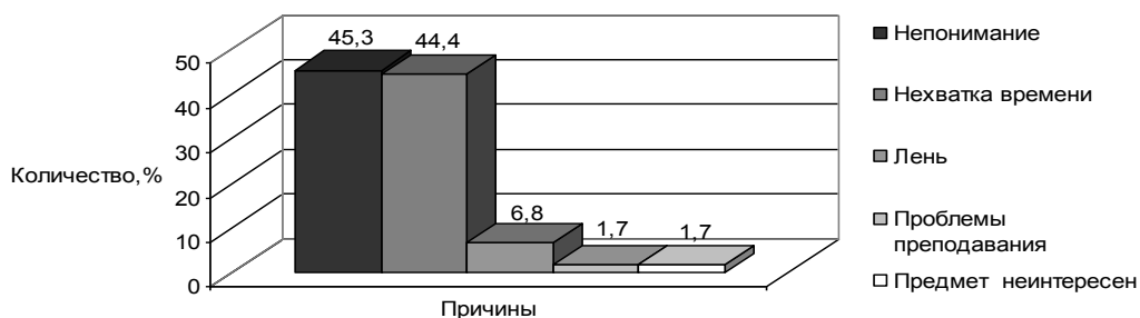
Рис. 1. Мотивация заказа готовых заданий

На вопрос «Приходилось ли Вам заказывать готовые задания (рефераты, курсовые, РГЗ и т.п.) по самостоятельной работе?» 34,2% студентов ответили положительно. Это свидетельствует о наличии практики заказов готовых заданий по самостоятельной работе. На вопрос о причинах заказа готовых заданий студенты выделили следующие мотивы, среди которых основное место занимают не знание, непонимание предмета (45,3%) и нехватка времени (44,4%) (см. рисунок 1).