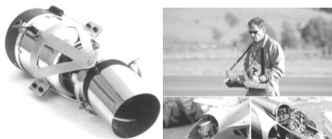
Рис. 29. Турбореактивный двигатель для модели

8. Турбореактивные двигатели, рисунок 29.