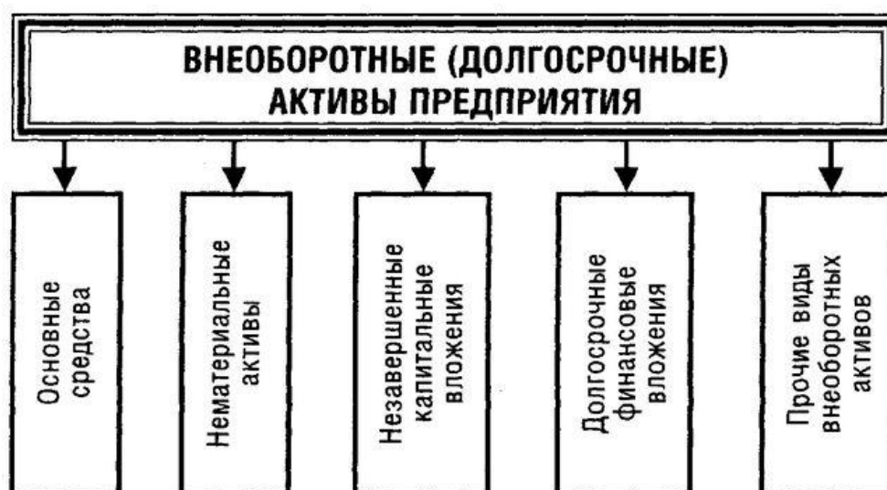
Рисунок 1.1 – Внеоборотные активы

Внеоборотными активами являются средства, используемые предприятием более одного года. Они отражены в разделе I актива и содержат следующие агрегированные статьи баланса: основные средства, нематериальные активы, доходные вложения в материальные ценности, долгосрочные финансовые вложения и незавершенное строительство (рисунок 1.1).