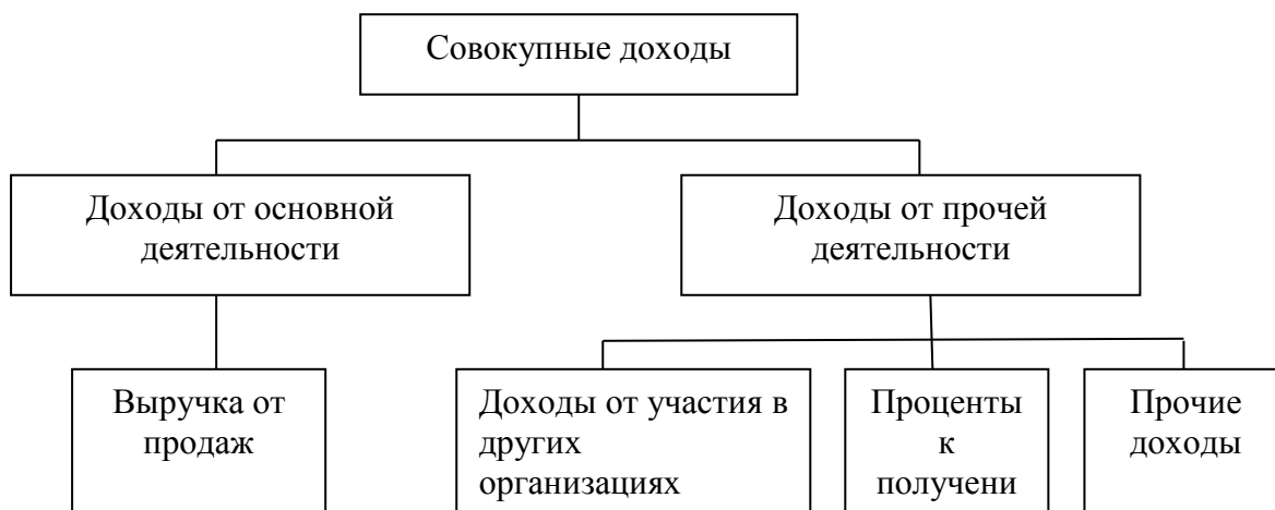
Рисунок 1.1- Состав совокупных доходов

В соответствии с п. 2 ПБУ 10/99 «Расходы организации», расходами организации признается уменьшение экономических выгод в результате выбытия активов (денежных средств, иного имущества) и (или) возникновения обязательств, приводящее к уменьшению капитала этой организации, за исключением уменьшения вкладов по решению участников (собственников имущества)[13].