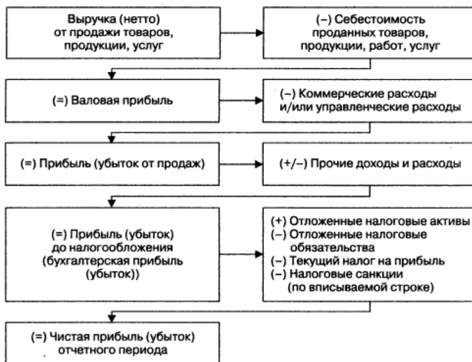
Рисунок 1 – Порядок формирования финансового результата

Порядок формирования финансового результата в соответствии с действующим законодательством можно представить следующим образом: