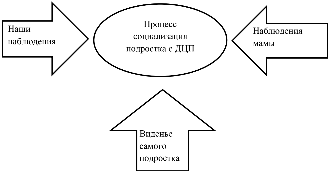
Рисунок А.1 – Схема анализа случая