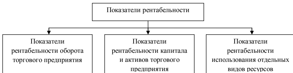
Рисунок 2 –Группировка показателей рентабельности деятельности торгового предприятия[12]

В экономической литературе существует более тридцати различных показателей (коэффициентов) рентабельности. Использование того или иного показателя зависит от целей анализа деятельности предприятия. Объединим распространенные показатели рентабельности предприятия в три группы рис. 2