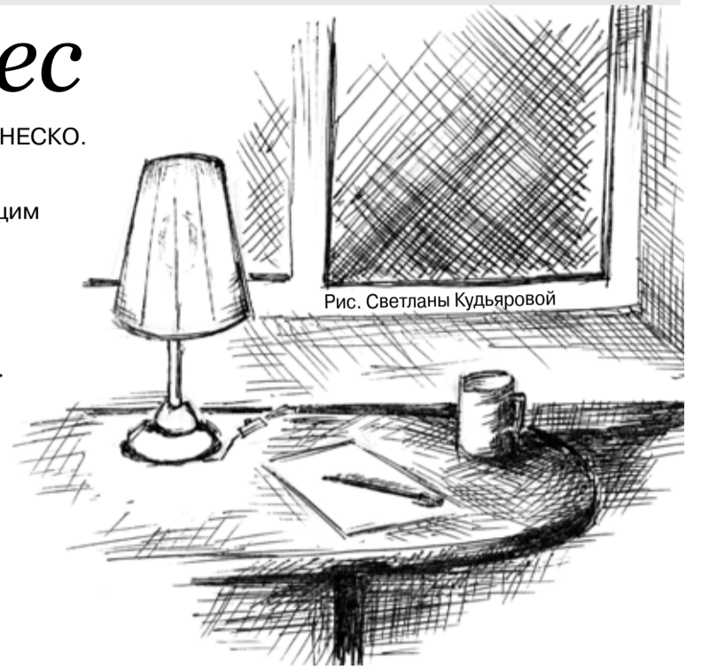
Рис. Светланы Кудьяровой

Дождик осенний ласковый То ли леса споласкивал, То ли лето оплакивал? Так я и не узнал. А у тебя, столбикочка, Что на щеке, дождиночка? Или это слезиночка? Чиста и солона. (1982 г., Столбы)