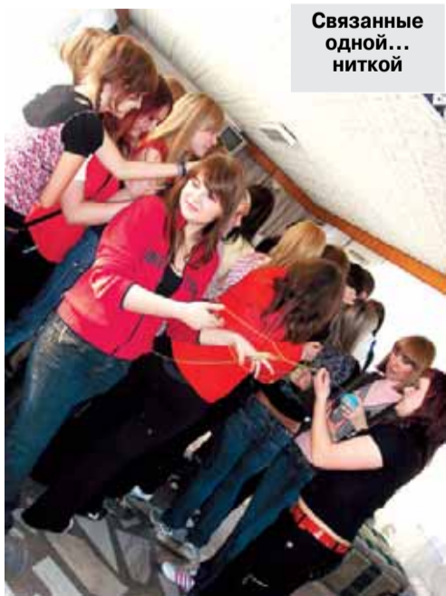
Связанные одной... ниткой

Этой весной первокурсники-пиарщики первый раз поехали на «погружение». Мероприятие состояло из различных учебно-игровых моментов и проводилось в санатории-профилактории «Лесной». Организацией занимались студенты, аспиранты и преподаватели кафедры социологии и общественных связей. В их нелегкую задачу входило представить пиар так, чтобы всем было понятно, что это такое. Ради этого программа поездки