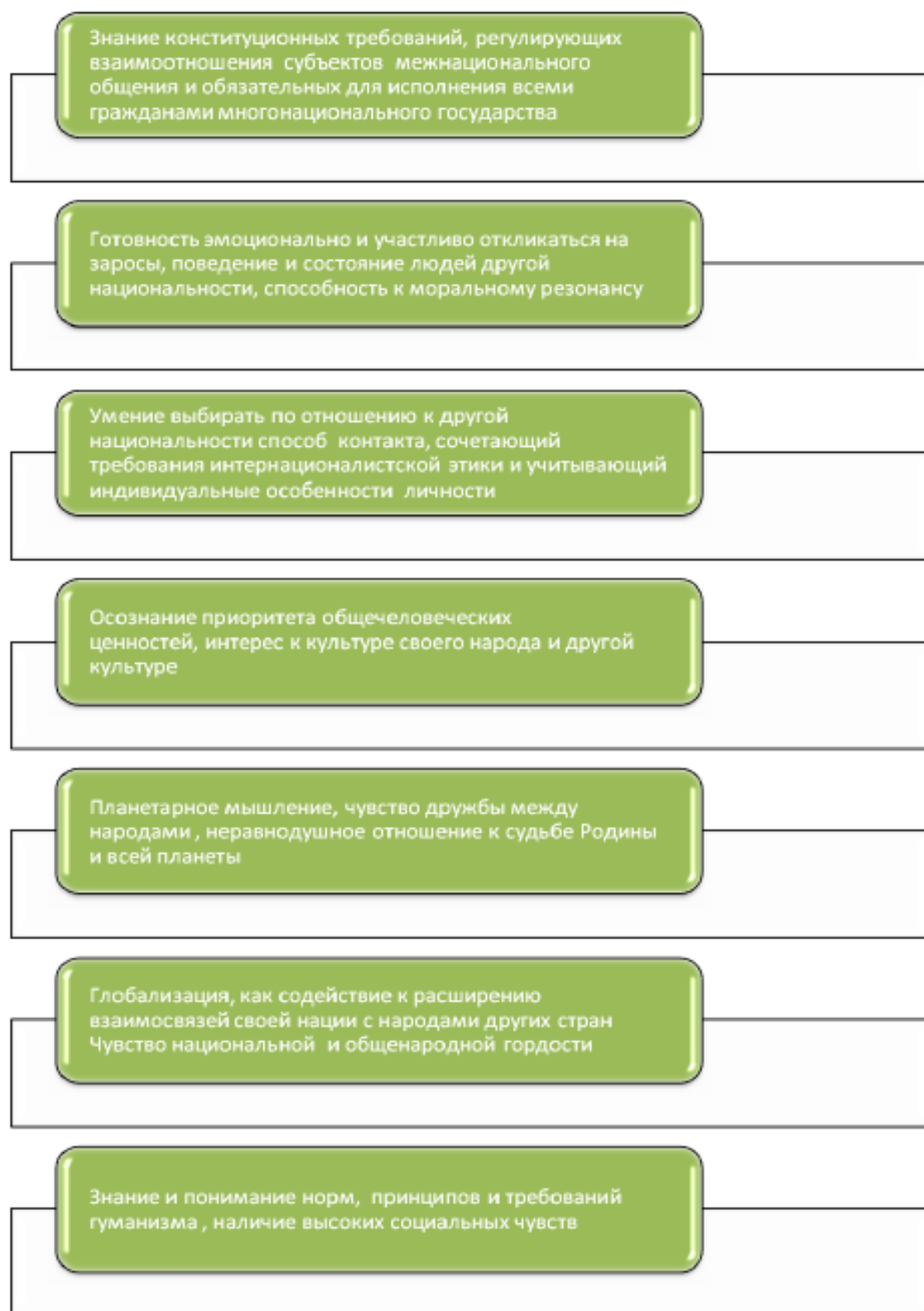
Рисунок 6 – Основные элементы культуры межнационального общения [14].

Можно выделить следующие элементы культуры межнационального общения: