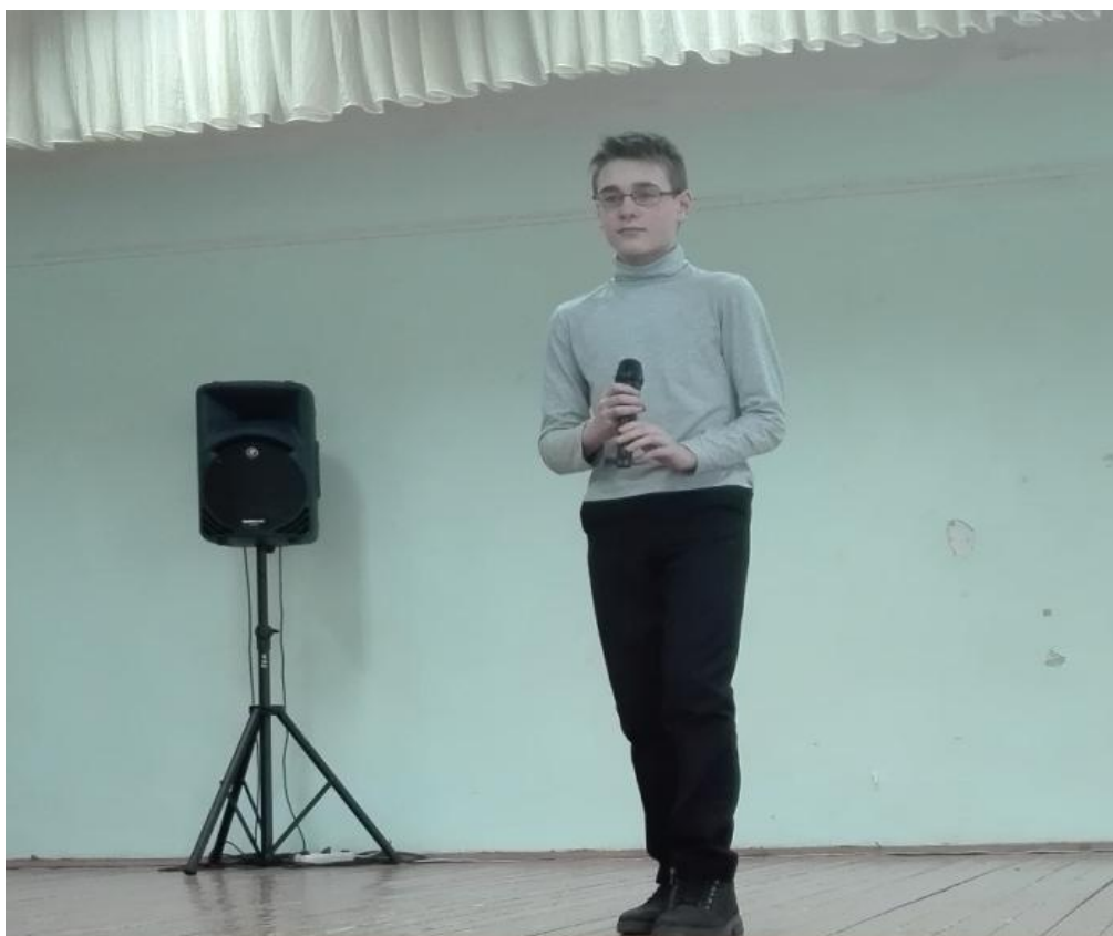
Рисунок 12 – Национальное стихотворение «Лезгиньы»