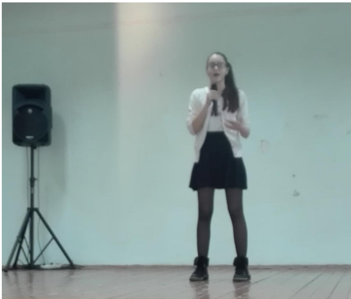
Рисунок 11 – Национальная песня «Украина»

Участники конкурса исполняли национальные песни, произведения фольклора на национальном языке, демонстрируют национальные танцы.