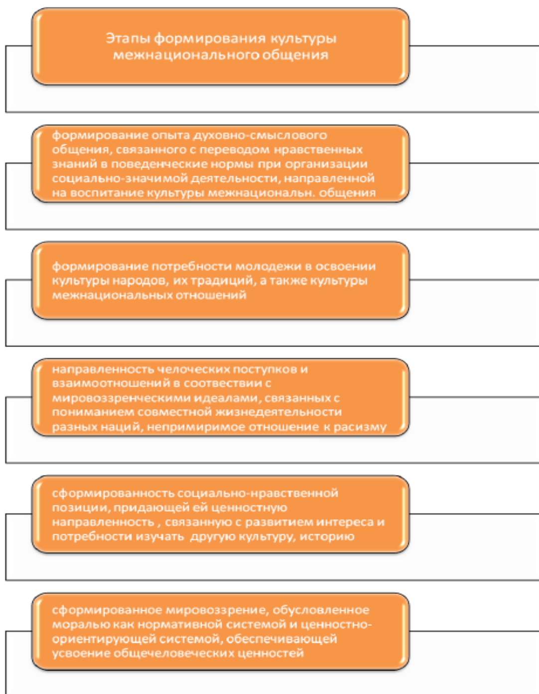
Рисунок 5 – Этапы развития культуры межнационального общения [14].

Как видно из представленных этапов развития процесса культуры межнационального общения, в нем выделяются несколько значимых КОМПОНЕНТОВ: