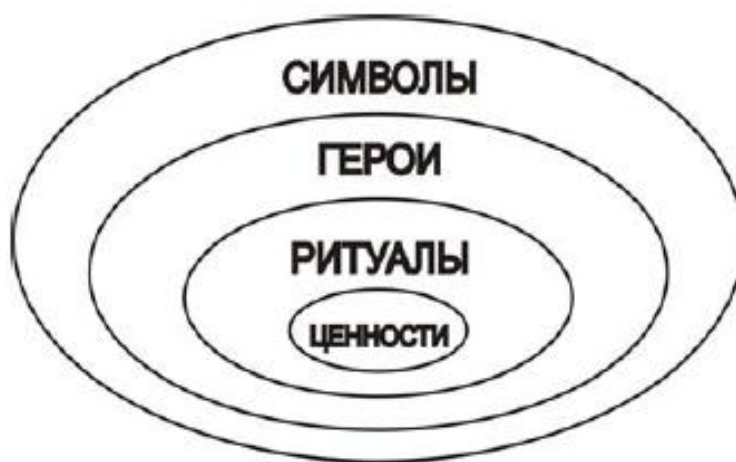
Рисунок 2 – «Луковичная» диаграмма Г. Хофстеде [29, с. 147].

Имеется также вариант понимания культуры межнационального общения с точки зрения Г. Хофстеде, который рассматривал четыре проявления любой культуры, в том числе и культуры межнационального общения: символы, герои, ритуалы, ценности.