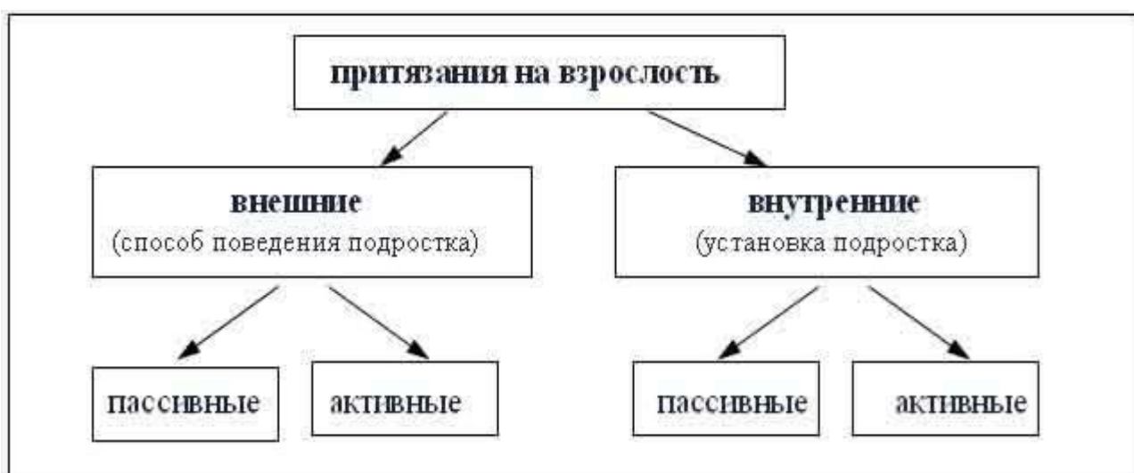
Рисунок 1 – Структура притязаний на взрослость [6, с. 95].

Общую структуру притязаний на взрослость можно увидеть на рисунке 1.