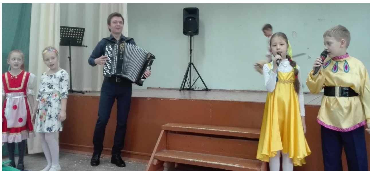
Рисунок 15 – Национальная песня «Россия»