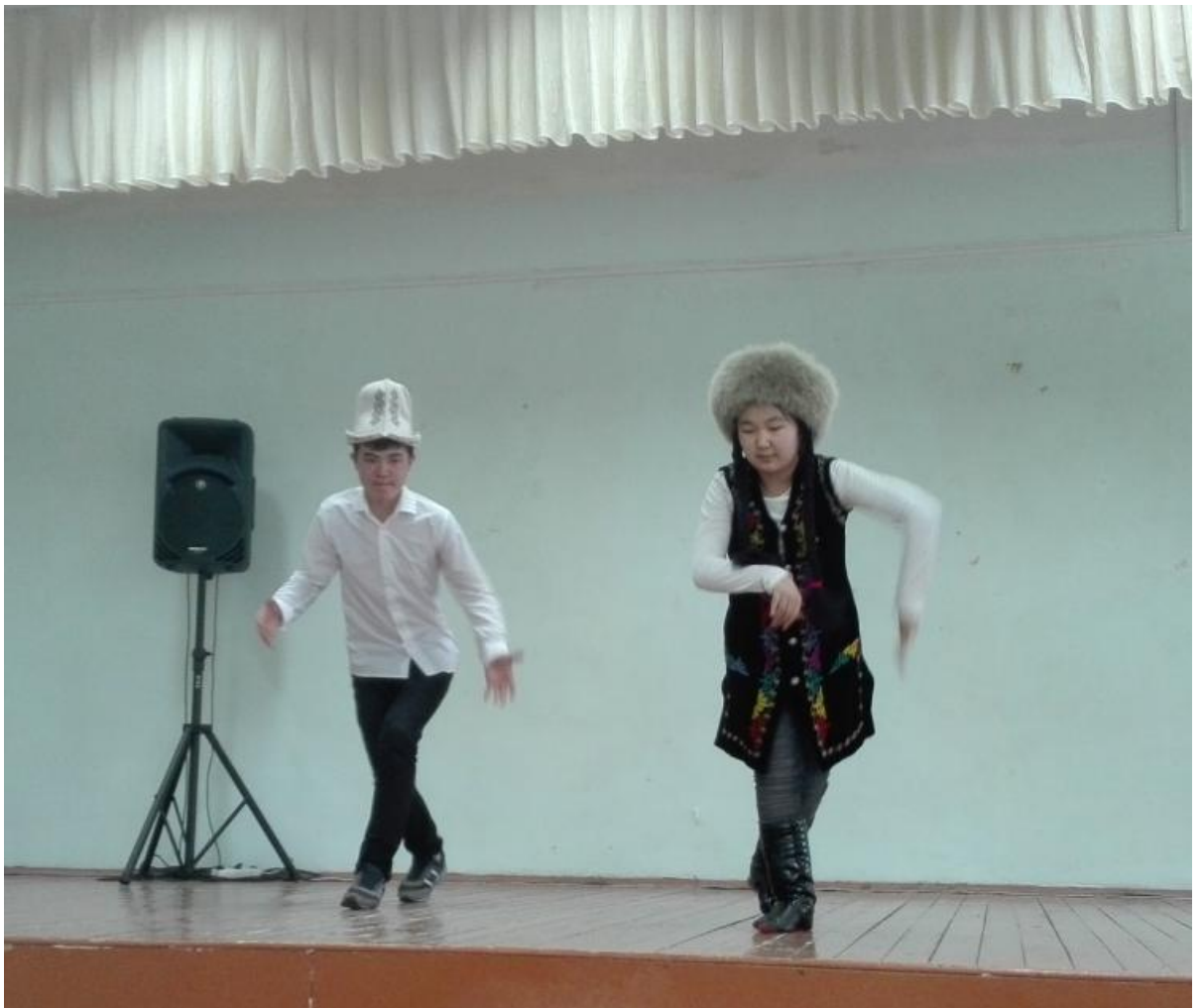
Рисунок 10 – Национальный танец «Киргизия»