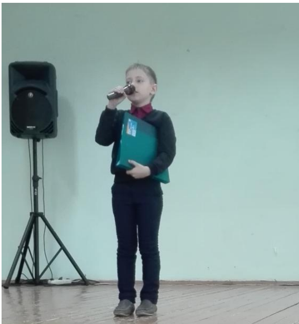
Рисунок 14 – Национальное стихотворение «Россия»