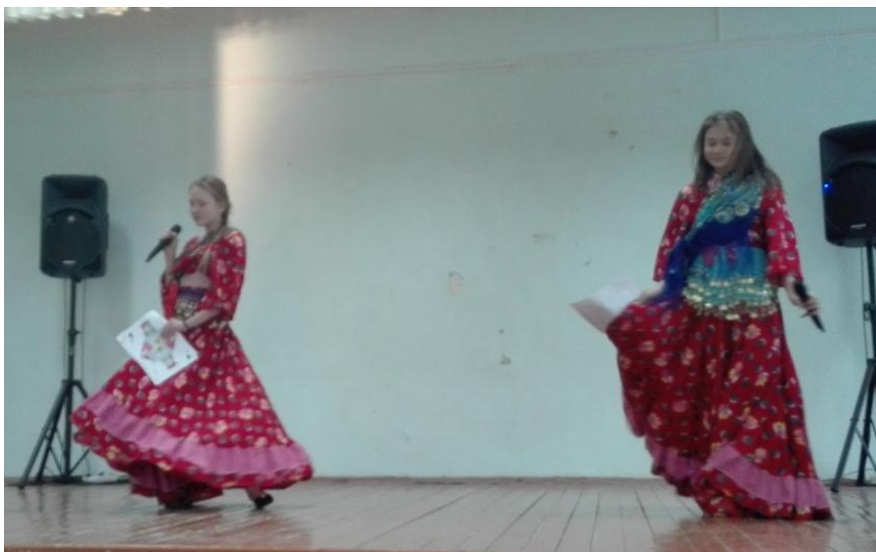
Рисунок 8 – Цыганский танец