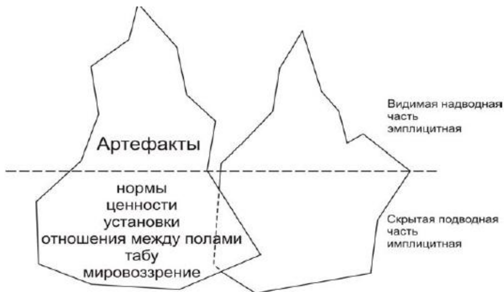
Рисунок 3 – Модель «Айсберг-Аналогии» [9].

Если анализировать видимую (осознаваемую) и невидимую (неосознаваемую) составные культуры, то межкультурное общение становится более насыщенным. Это прием «айсберг-анalogии» [9, с. 48], согласно которому любая культура может быть представлена в виде айсберга, имеющего надводную и подводную части.