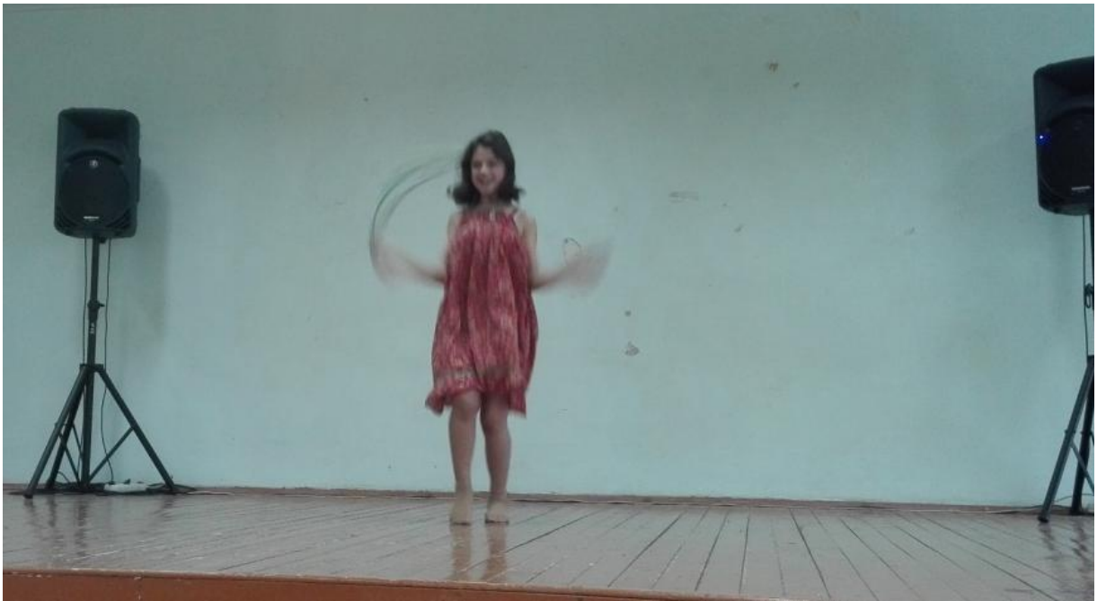
Рисунок 9 – Национальный танец «Россия»