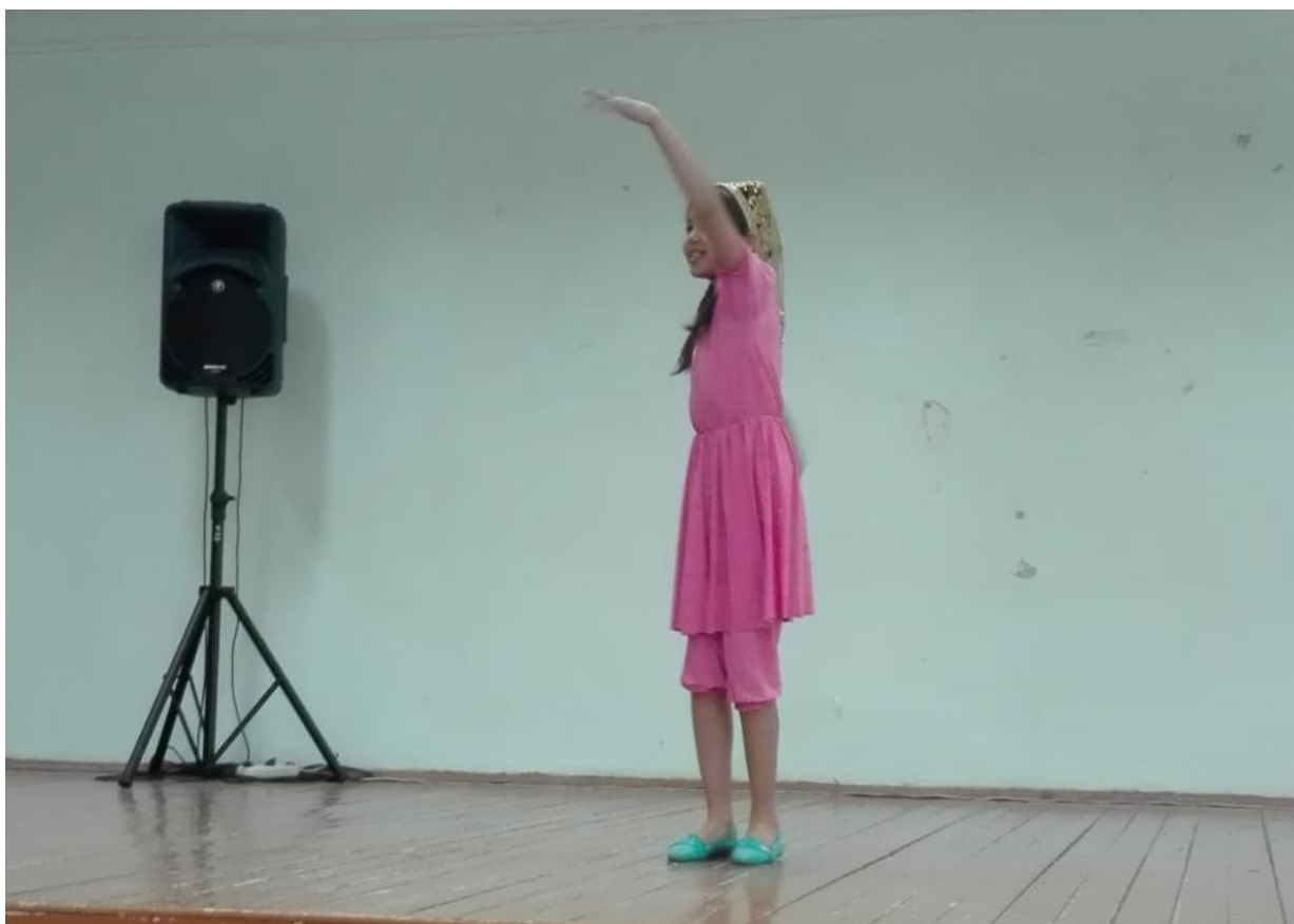
Рисунок 7 – Национальный танец «Узбекистан»