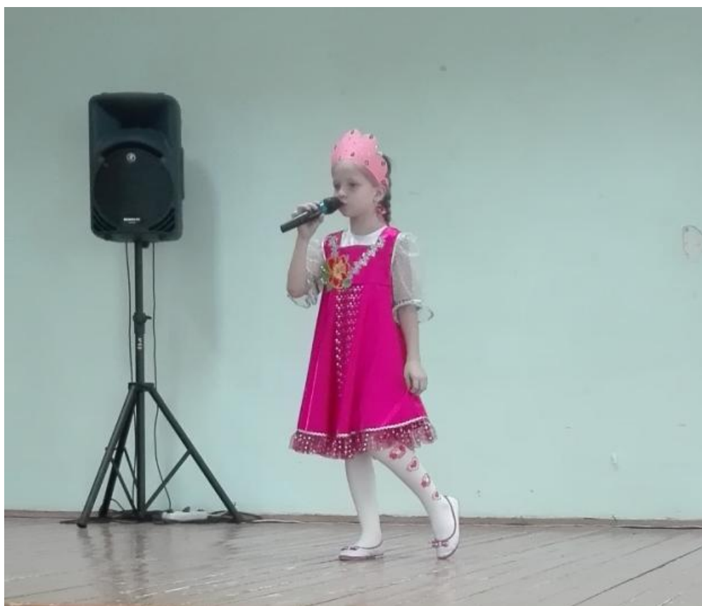
Рисунок 13 – Национальная песня «Россия»