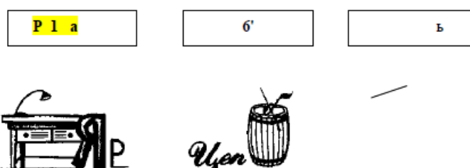
Рисунок 4 – «Ребусы»

«Школьные математические олимпиады представляют собой более массовые соревнования, поскольку они охватывают учеников не одного, а всех параллельных классов школы» [17, с. 144].