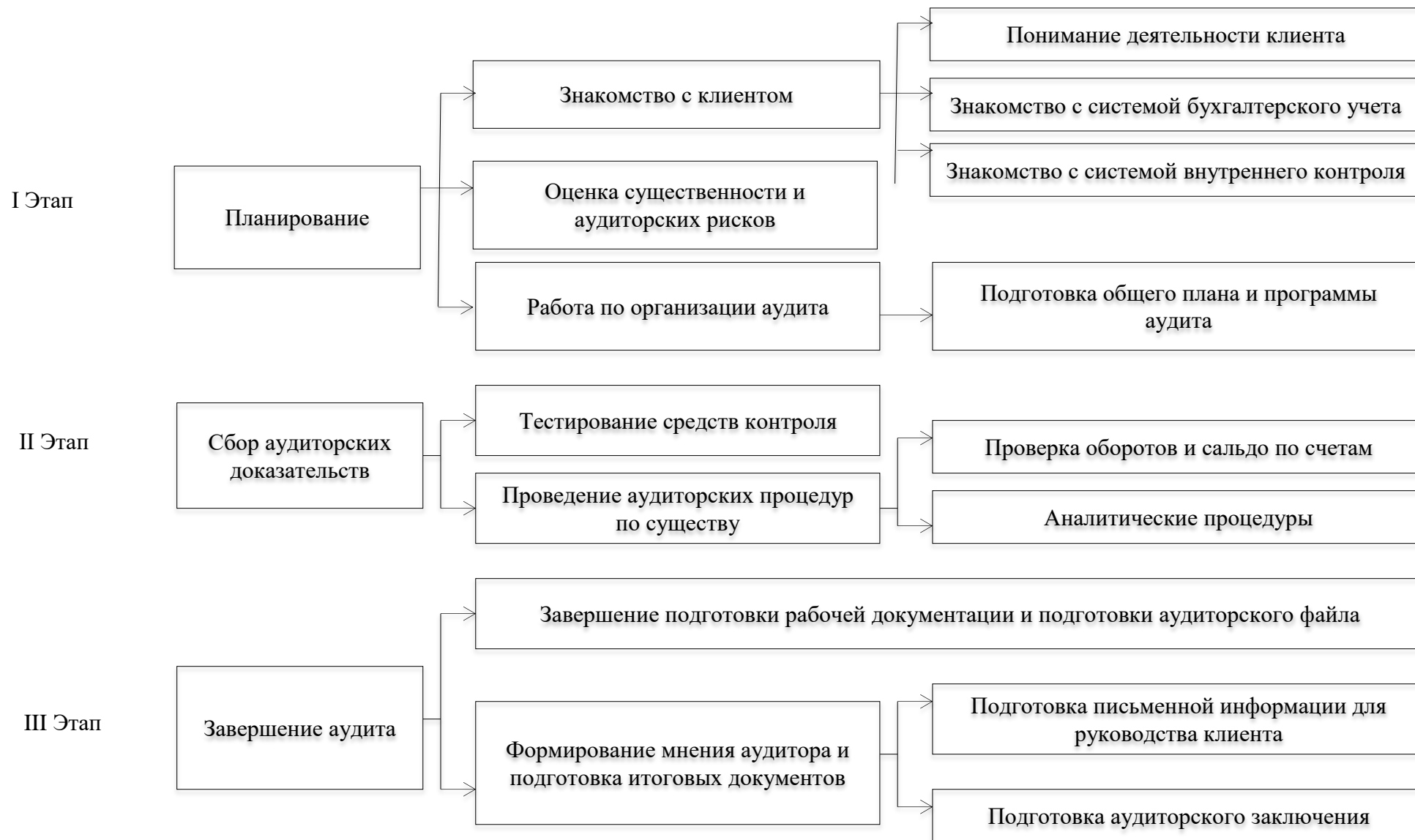
Рисунок 1.1 - Основные этапы проведения аудиторской проверки [60]