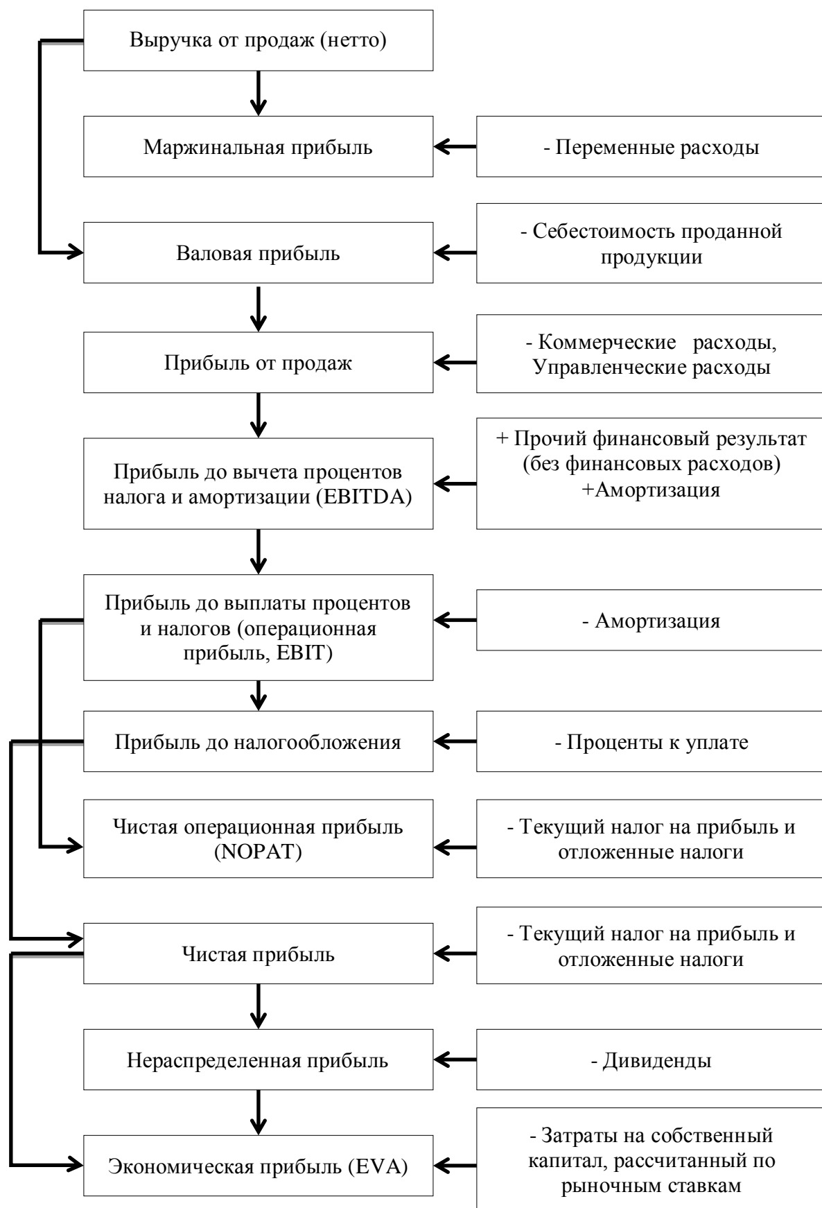
Рисунок 3 – Схема формирования операционной прибыли коммерческих организаций