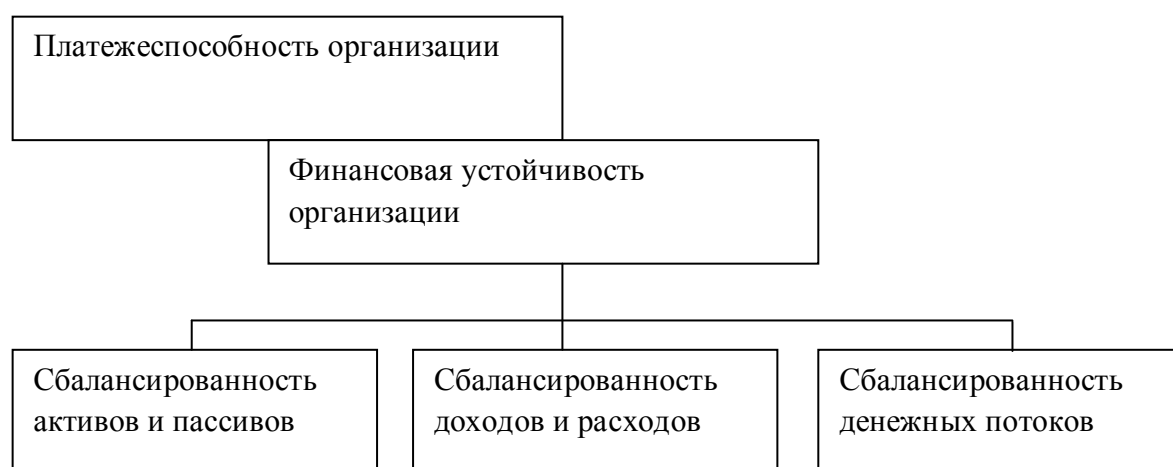
Рисунок 1 - Схема взаимосвязи финансовой устойчивости и платежеспособности организации [10]

Рисунок 1 показывает взаимосвязь платежеспособности и финансовой устойчивости [10].