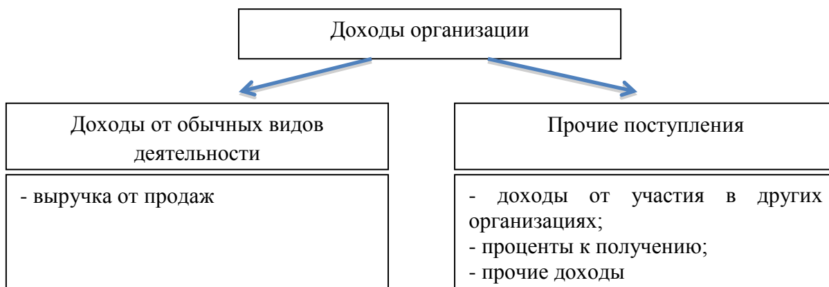
Рисунок 1 – Классификация доходов организации согласно структуре отчета о финансовых результатах

Классификация доходов организации в зависимости от направления деятельности и структуры отчета о финансовых результатах представлена на рисунке 1.