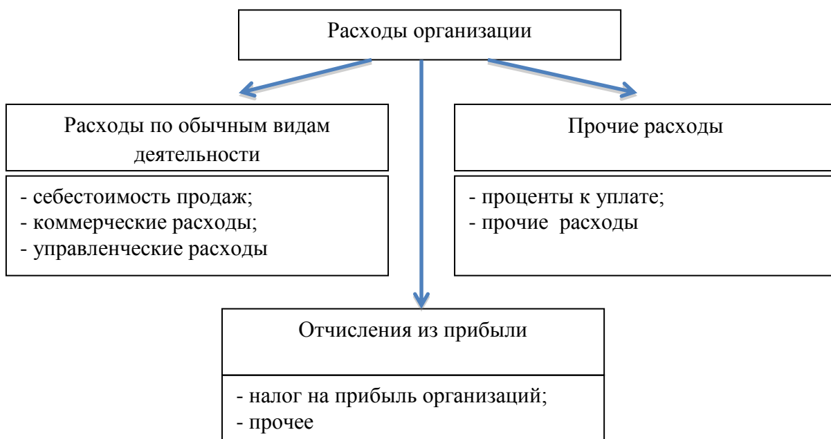
Рисунок 2 – Классификация расходов организации согласно структуре отчета о финансовых результатах

Расходами по обычным видам деятельности являются расходы, связанные с изготовлением продукции и продажей продукции, приобретением и продажей товаров. Такими расходами также считаются расходы, осуществление которых связано с выполнением работ, оказанием услуг.