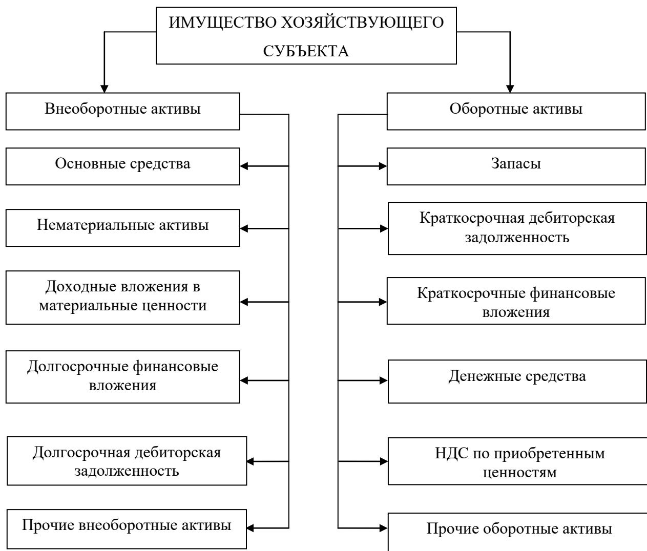
Рисунок 1 – Состав имущества хозяйствующего субъекта

Состав имущества организации с группировкой по сроку обращения (оборотные – до 12 месяцев, внеоборотные - более 12 месяцев) представлен на рисунке 1.