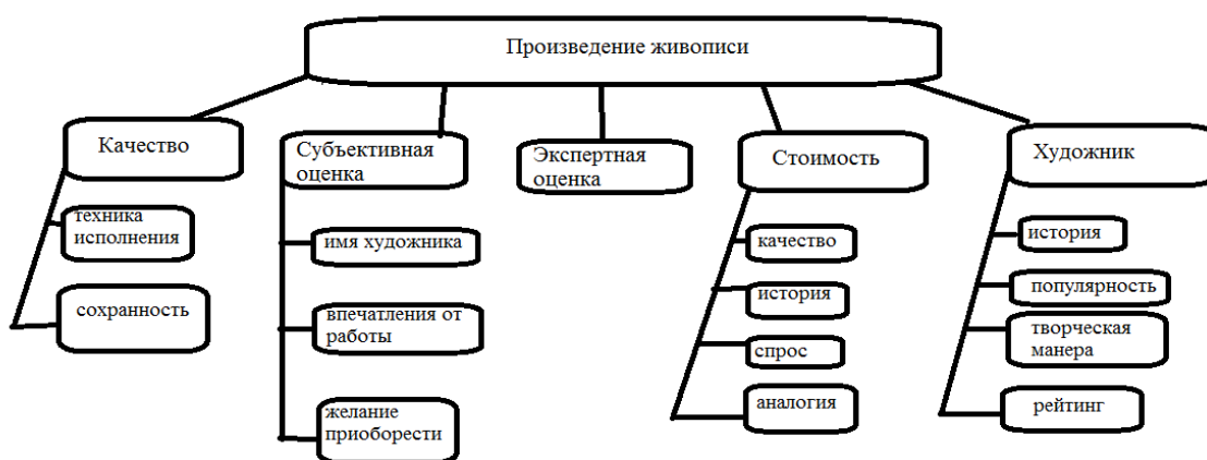
(Рисунок 2.5 – Схема алгоритма оценивания)

В ходе разработки был составлен алгоритм оценивания (Рисунок 2.5)