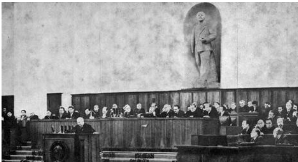
Рисунок – Фото «Объявление приговора по делу Синявского и Даниэля, 1966г.», авт. Виктор Кошевой 133