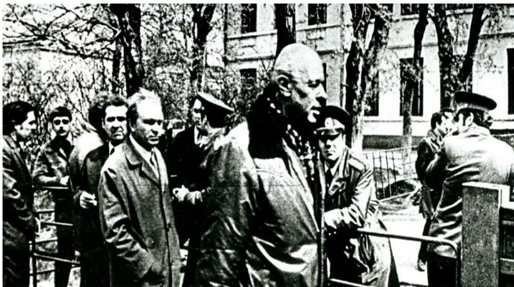
Рисунок – Фото «В дни суда над Юрием Орловым. Москва, Люблино, 15-18 мая 1978» 135