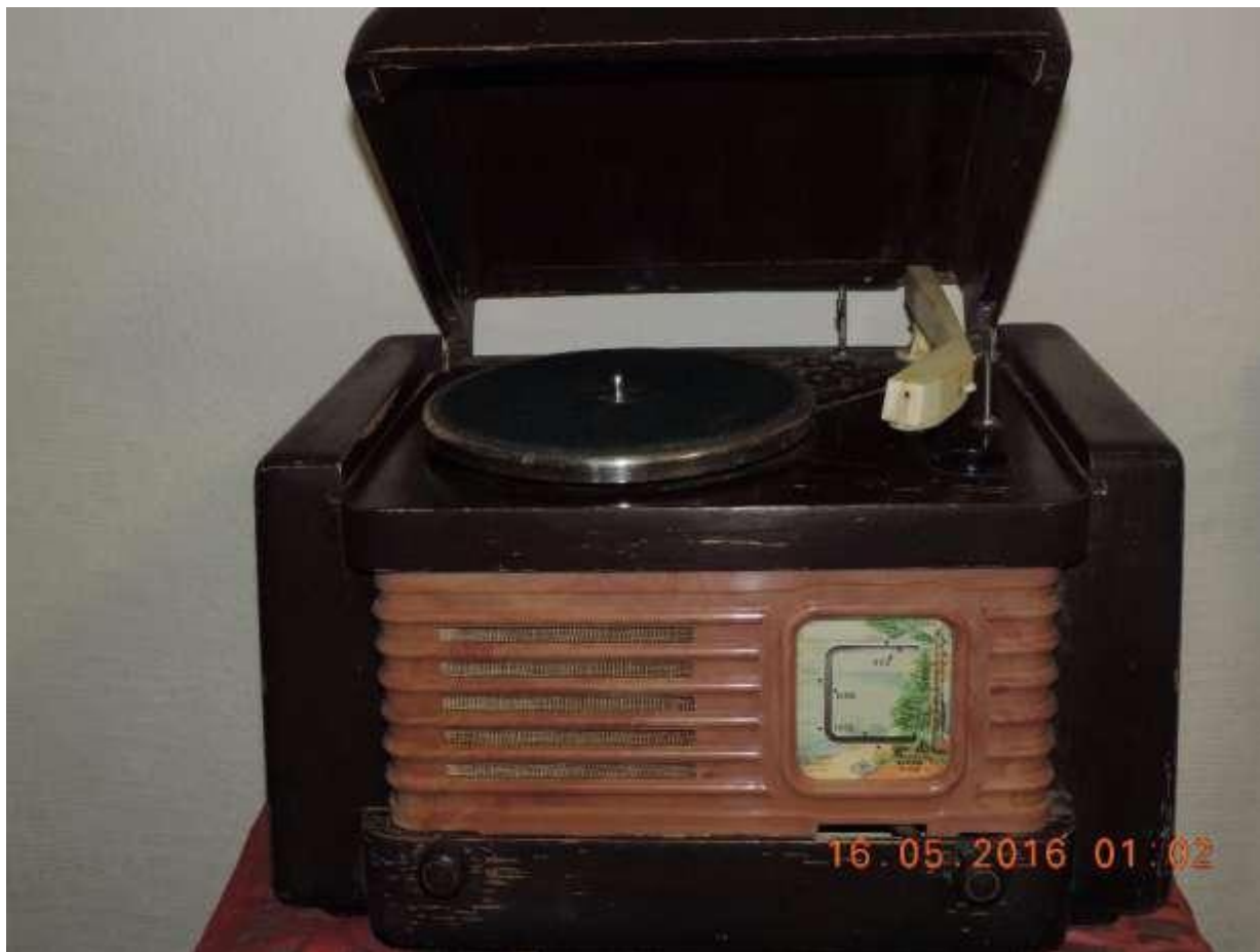
Рисунок – Фото «Радиола «Кама» 1952 г. выпуска» 137 . авт. Мажукин И.И.