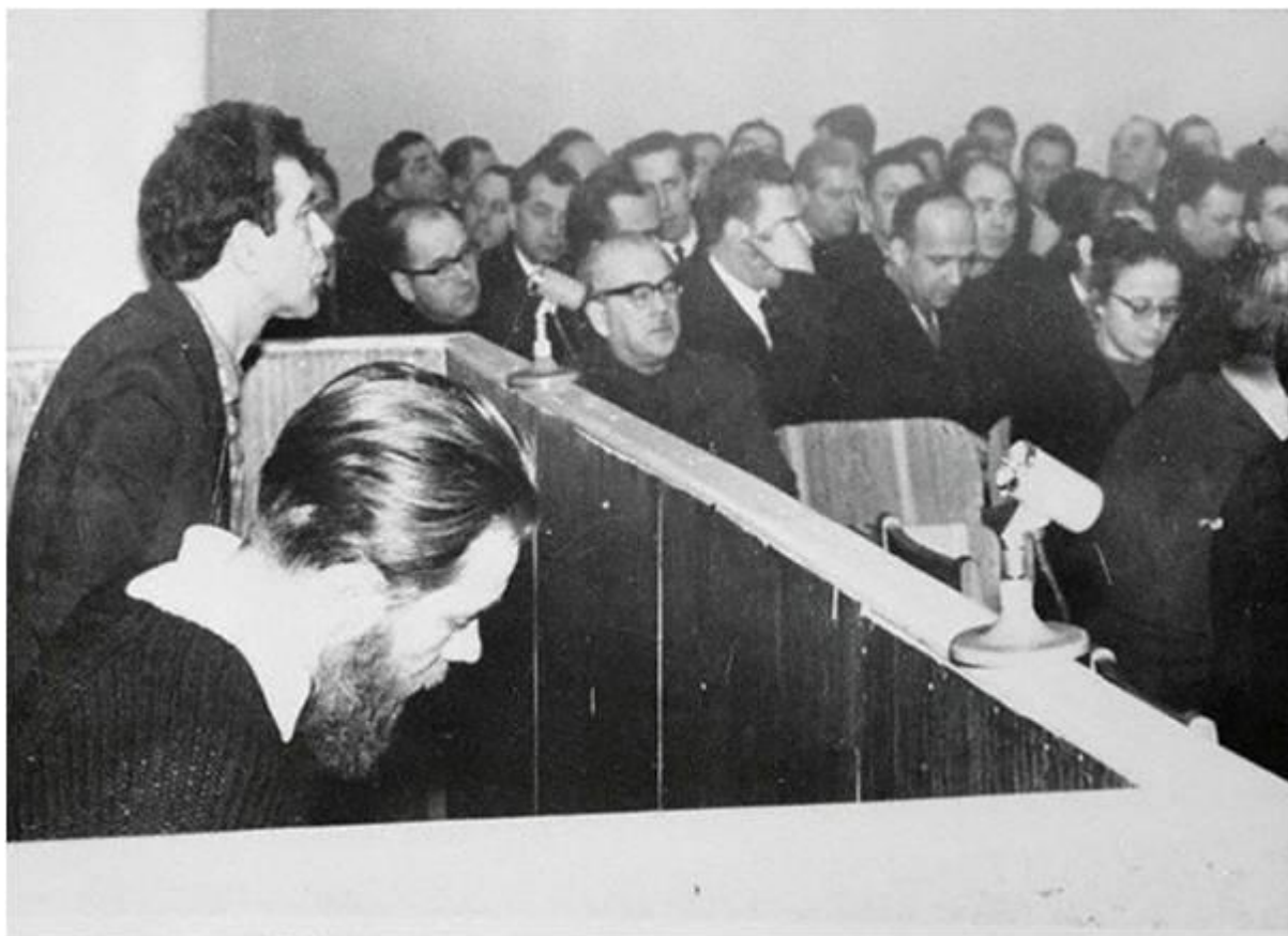
Рисунок – Фото (Юлий Даниэль (слева) и Андрей Синявский) 132