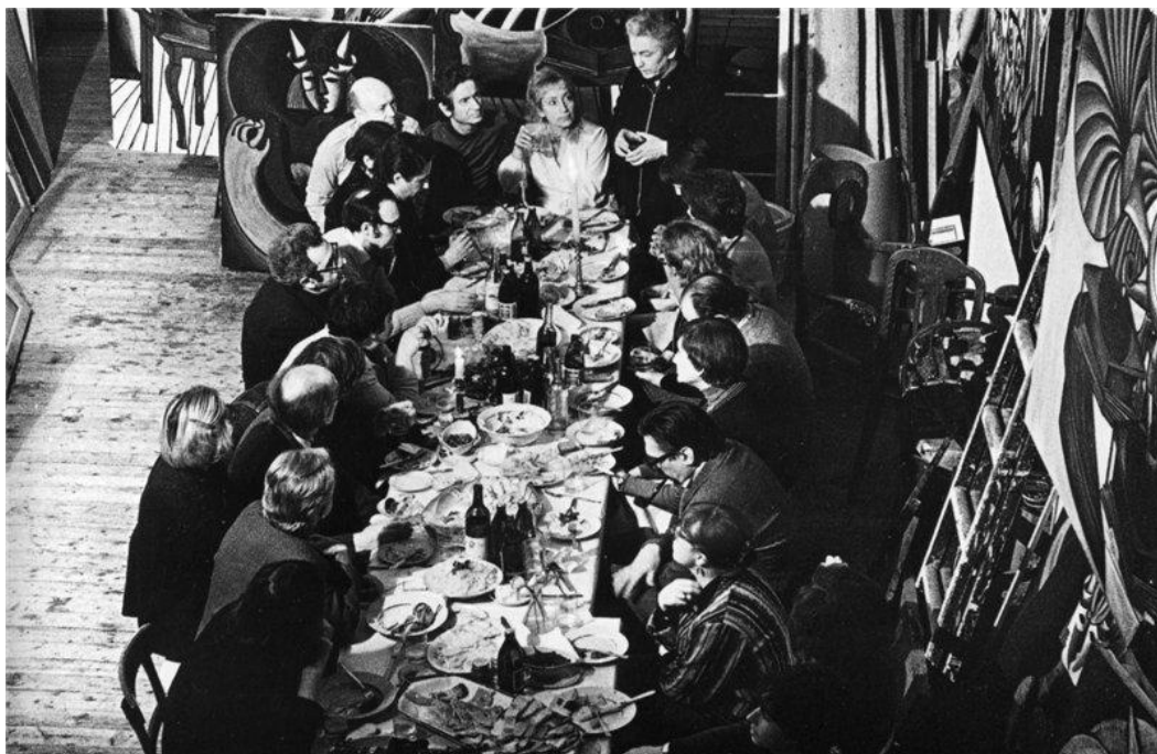
Рисунок – Фото «Проводы писателя Войнова в эмиграцию», авт. Эдуард Гладков 138