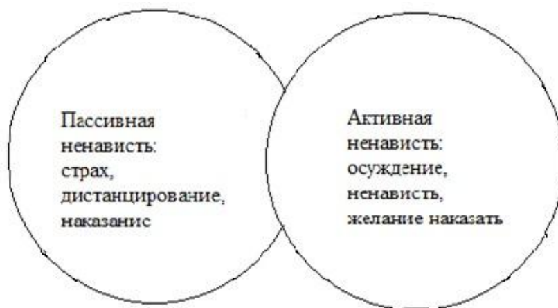
Рисунок 1 – Двухфакторная структурная модель ненависти

ганием контактов с предметом ненависти, тогда как второй характеризуется осуждением, гневом и желанием наказать объект ненависти (см. рис. 1). Чаще всего в качестве предмета ненависти оказывался не отдельный человек, а группа, что является известным подтверждением интергрупповой природы ненависти [3, с 145].