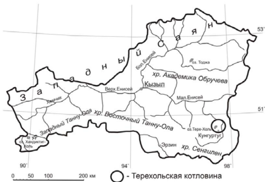
Рис. 2. Карта района исследования. Терехольская котловина, Тыва, Россия

(табл. 1). Общее количество модельных деревьев возрастом более 100 лет 112 шт.