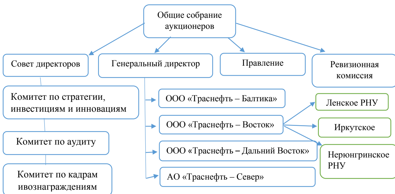
Рисунок 1 –организационная структура ОАО «АК «Транснефть»

На рисунке 1 представлена организационную структуру предприятия.