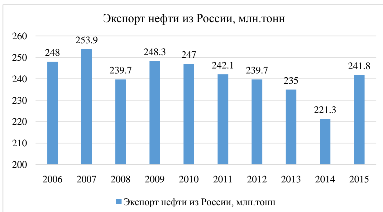
Рисунок 3 – динамика экспорта нефти из России

Что касается экспорта, то по итогам 2015 г., его объем достиг 241,8 млн т. Рост экспорта нефти в 2015 г., по сравнению с предыдущим годом составил 20,5 млн тонн (+9,3%). На рисунке 3 можно увидеть динамику экспорта нефти из России.