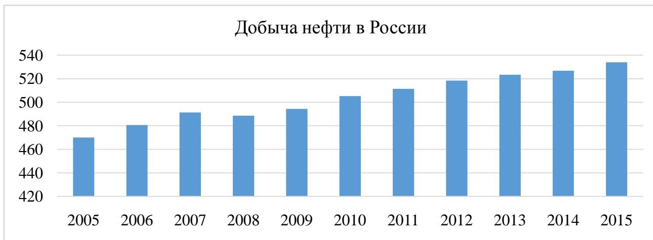
Рисунок 2 – динамика добычи нефти в России

За 2015 год Россия установила новый рекорд по добыче нефти. Добыча нефти и газового конденсата составила 534 млн.т. что на 1,4% выше 2014 года. На рисунке 2 можно проследить динамику добычи нефти в России.