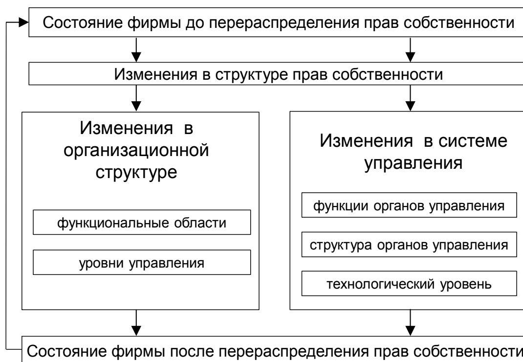
Рисунок 2 – Влияние изменений в структуре прав собственности фирмы на внутрифирменные процессы

Перераспределение прав собственности на фирму приводит к целому ряду взаимосвязанных изменений целевых установок, организационной структуры, системы управления, объёма используемых ресурсов, распределения ресурсов между подразделениями внутри фирмы, числа транзакций и их стоимости. Такие изменения можно увидеть в работе любого подразделения и на всех уровнях управления фирмой. Последовательность изменений, происходящих в результате перераспределения прав собственности, а также их влияние на внутрифирменные процессы представлена в виде общей схемы, изображенной на Рисунке 2.