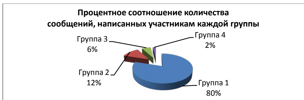
Рисунок 1. Диаграмма общения коммуникантов с участниками группы

Ниже приведена диаграмма (рис.1) общения коммуникантов с участниками группы. Нами были взяты все сообщения социальной сети «Вконтакте» и электронной почты исследуемых пользователей за последний месяц. Больше всего сообщений было адресовано группе №1 – 80% от общего числа. 12% сообщений отправлено группе №2. Группе №3 поступило 6% писем от общего числа и группе №4 – 2%.