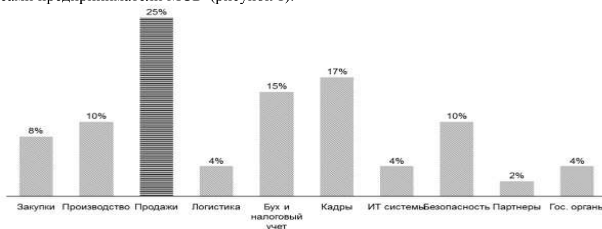
Рисунок 1: - Результаты опроса предпринимателей. Ответы на вопрос: какие виды рисков наиболее существенны для вашего бизнеса?

В октябре 2012 года комитет по управлению рисками при Ассоциации Молодых Предпринимателей России провел краткий опрос на тему управления рисками среди российских предпринимателей, опрос показал те риски, которые определяют для себя сами предприниматели МСБ (рисунок 1).