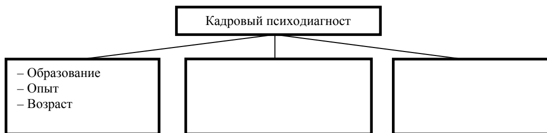
Рисунок 1 – Критерии отбора специалистов

Для того чтобы сформировать эффективную команду проекта, необходимо определить ряд требований, предъявляемых к членам команды. Критерии отбора специалистов представлены на рисунке 1.