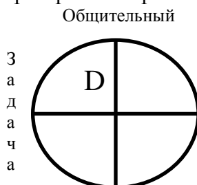
Рисунок 2 – Типология личности DISC

При отборе команды проекта также необходимо учитывать индивидуально-психологические особенности специалистов: умение работать в группе; самостоятельность; ответственность; склонность к риску и так далее. Для определения таких особенностей каждого кандидата используем методику DISC (рисунок 2), разработанную американским оратором Робертом А. Ромом[2].