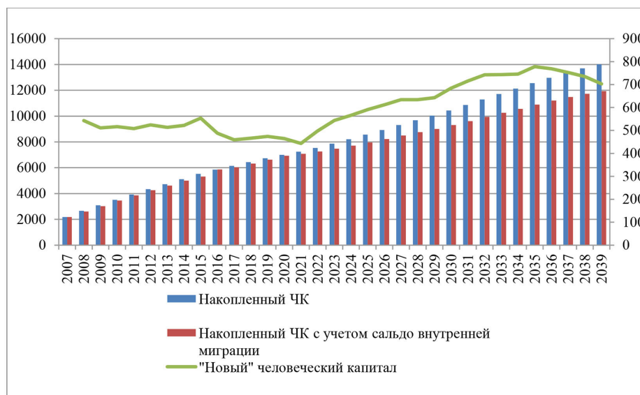
Рис. 2. Динамика (2007–2021) и прогноз (2022–2038) величины накопленного человеческого капитала в Азиатской России, млрд рублей